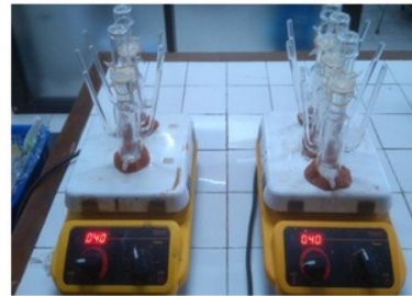
Gambar 2. Alat uji difusi tegak Franz