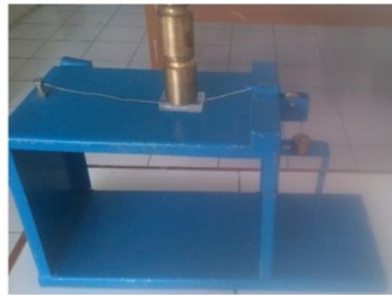
Gambar 1. Alat uji daya lekat

Bahan yang digunakan dalam penelitian ini adalah minyak atsiri bunga cengkeh (MABC) yang diperoleh dari Center of Essential Oil Studies (CEOS) Universitas Islam Indonesia, Yogyakarta. Bahan tambahan lain yang digunakan dalam formulasi sediaan emulgel adalah pharmaceutic grade meliputi carbopol 940, trietanolamin, propilen glikol, asam oleat, paraffin cair, sorbitol, span 80, tween 80, metil paraben, propil paraben, aquadest. Semua bahan untuk formulasi emulgel diperoleh dari PT Elico Chemica Yogyakarta. Kulit hewan uji yang digunakan berasal dari kulit punggung tikus putih jantan galur Sprague-dawley usia 2-3 bulan. Alat uji daya lekat salep ditunjukkan dalam gambar 1, sedangkan alat sel difusi tegak Franz diperlihatkan dalam gambar 2.