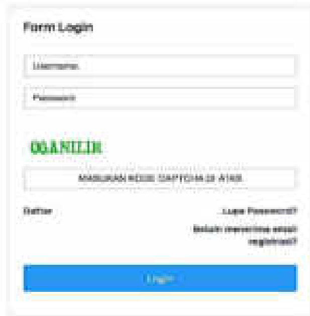
Gambar 2. Tampilan untuk Masuk ke Akun