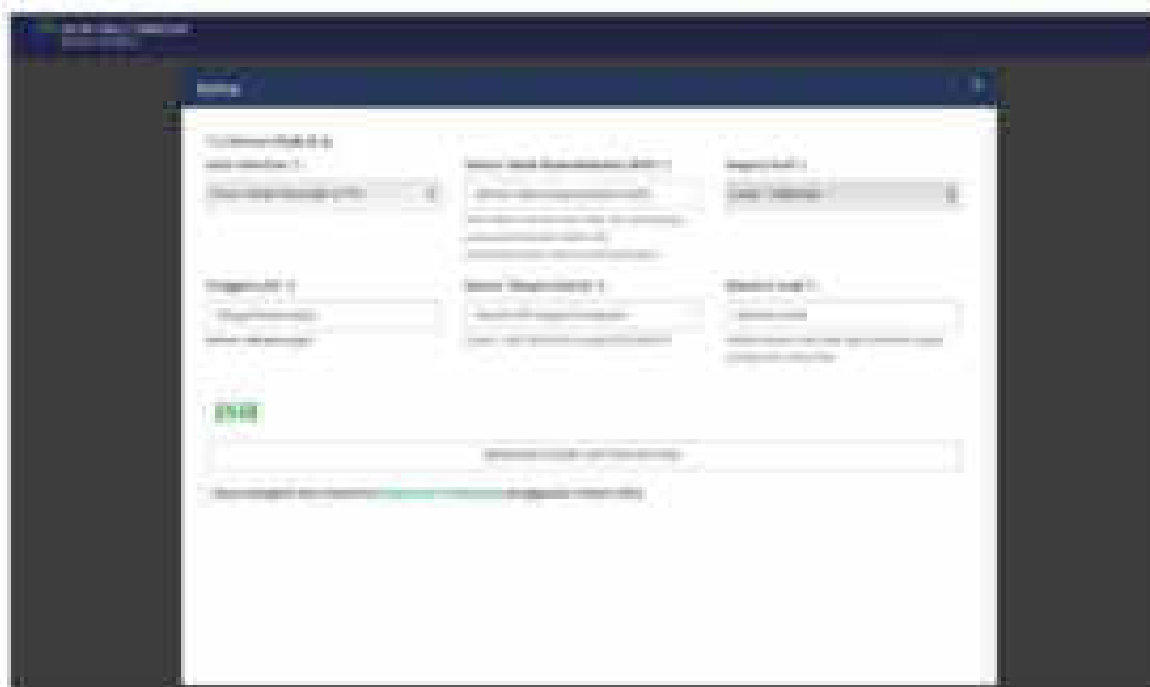
Gambar 3. Formulir Pendaftaran Akun