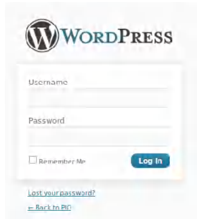
Gb 1 - Halaman login

Isikan username dan password lalu tekan tombol login, maka akan tampil halaman dashboard