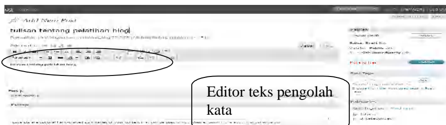
Gb 4 hal.menmu add new