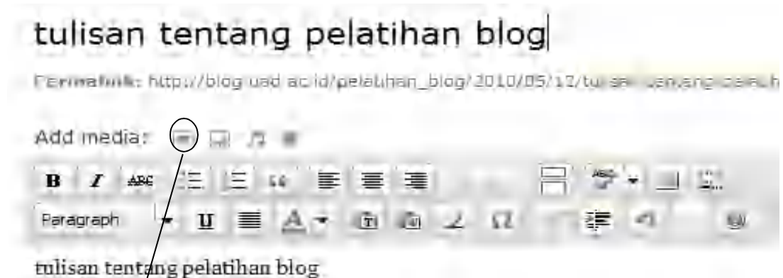
Gb 5 menyisipkan gambar