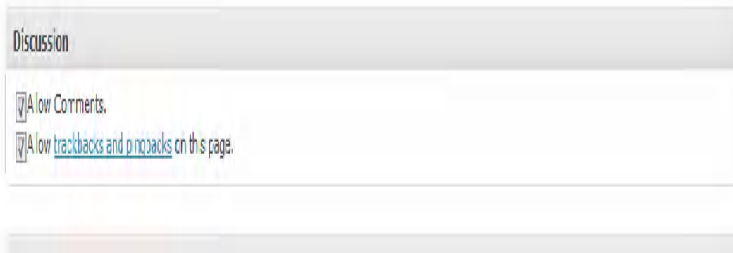
Gb 6 discussion

lakukan un-check pada bagian allow comments dan allow trackbacks and pingbacks on this page