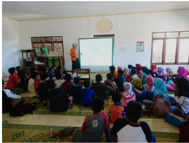
Gambar 2. Achievement Motivation Training (AMT)

Kegiatan AMT ini bertujuan untuk memberikan motivasi dan menambah semangat belajar anak-anak/santri TPA di desa Kanigoro. Salah satu mahasiswa berperan sebagai motivator/instruktur yang menguasai jalannya acara dan menjadi pusat perhatian para santri TPA. Ditampilkan beberapa slide dan video menarik menggunakan layar proyektor yang menambah antusias para santri dalam belajar bersama. Santri belajar bersama tentang cinta pada orang tua, hobby, cita-cita, belajar dengan konsentrasi hingga permainan dan ice breaking . Mereka terlihat begitu gembira dan bersemangat.