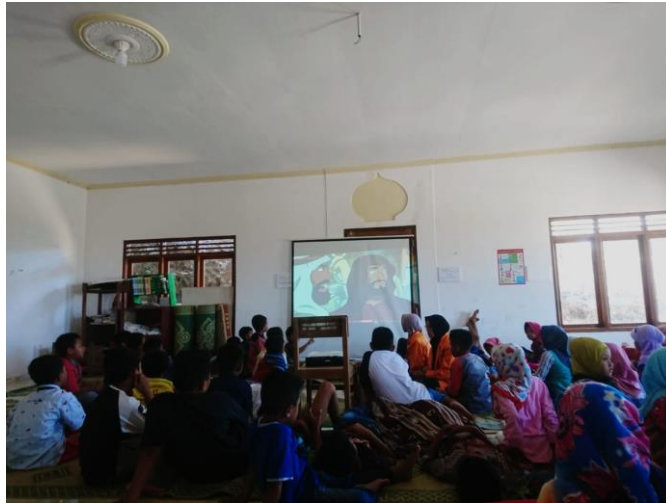
Gambar 3. Pemutaran Film Islami