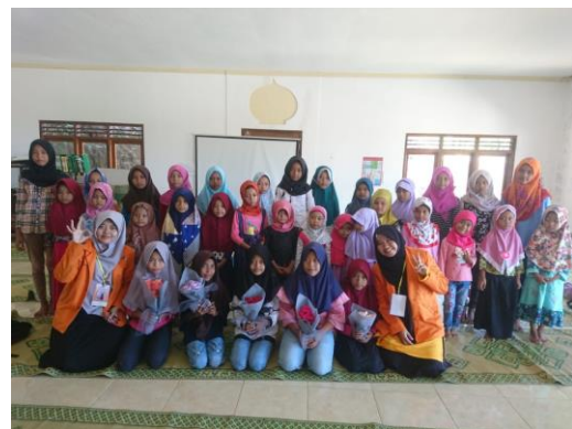
Gambar 1. Pembuatan Bouquet Bunga