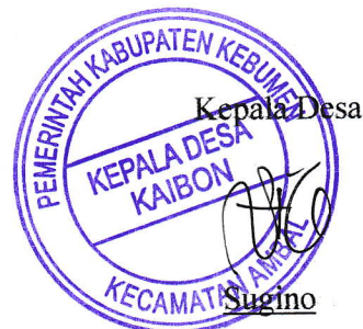
Sugino Kepala Desa