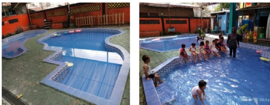
Gambar 2. Kolam Renang Anak Perempuan dan Laki-laki di TK Aisyiyah Nyai Ahmad Dahlan Yogyakarta

analisis lebih lanjut, apakah guru perempuan juga lebih unggul kemampuan matematikanya daripada guru laki-laki dan apakah keunggulan tersebut hanya di bidang matematika serta tidak berlaku pada bidang yang lain? Jika kemampuan akademik anak perempuan, terutama pada jenjang pendidikan dasar lebih unggul daripada anak laki-laki, mengapa jumlah perempuan yang menempuh jenjang pendidikan tinggi, semakin termarjinalkan?