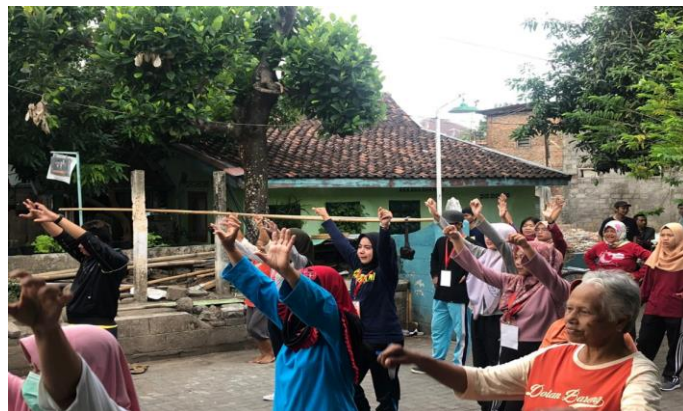
Gambar.3 Kegiatan Senam Lansia

Kelompok KKN kami juga mengikuti agenda rutin yang dilaksanakan di RW 03, seperti mengikuti arisan ibu-ibu PKK RW dan RT, mengikuti jalan sehat lansia, pengajian bapak-bapak, mengikuti senam sehat lansia, mengikuti dan membantu pendampingan lomba senam poco - poco, dan masih banyak lagi kegiatan rutin yang dilakukan selama 2 bulan dalam kegiatan KKN.