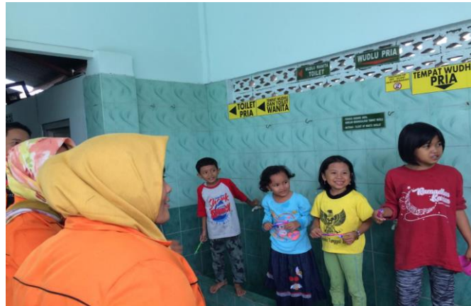
Gambar.2. Kegiatan PHBS

Kegiatan yang dilaksanakan oleh mahasiswa KKN beragam yaitu pelatihan kerajinan tangan, contohnya mengajarkan anak – anak membuat gelang, kalung dari berbagai jenis manik – manik. Kemudian kami juga mengajarkan cara mengkreasikan kertas origami menjadi berbagai bentuk seperti burung dan bunga. Tidak hanya kerajinan tangan kami juga melaksanakan kegiatan PHBS (Perilaku Hidup Bersih Sehat) yang diikuti oleh anak – anak, dalam kegiatan ini anak – anak sangat antusias.