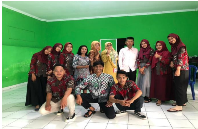
Gambar 6. Penarikan KKN

Sebelum mahasiswa KKN penarikan, kelompok KKN kami mengikuti acara piknik lansia ke Semarang yang merupakan kegiatan rutin dari lansia Penunping di akhir tahun. Tujuannya adalah untuk menghilangkan jenuh dan menambah kekeluargaan antar warga. Setelah itu kami dan pengurus lansia juga mengadakan perpisahan sebelum penarikan serta bernostalgia dengan menayangkan video kegiatan – kegiatan kami KKN selama 2 bulan di RW 03. Selama 2 bulan kami KKN, banyak sekali kegiatan yang telah dilaksanakan, baik itu kegiatan yang terjadwal ataupun tidak terjadwal. Kegiatan demi kegiatan dilakukan dengan penuh keikhlasan. Tidak hanya itu kami merasa sangat dekat penuh kekeluargaan dengan warga RW 03 yang mayoritasnya adalah lansia. Selain lansia, kamu pun juga dekat dengan remaja-remaja masjidnya. Sekilas itu beberapa kisah perjalanan yang telah diukir oleh teman-teman pejuang KKN Alternatif 64 dari Unit II.C.3. Semoga kegiatan yang telah kami laksanakan dapat bermanfaat bagi masyarakat sekitar dan pelajaran bersosialisasi di masyarakat mampu kami terapkan dalam kehidupan sehari-hari dengan baik.