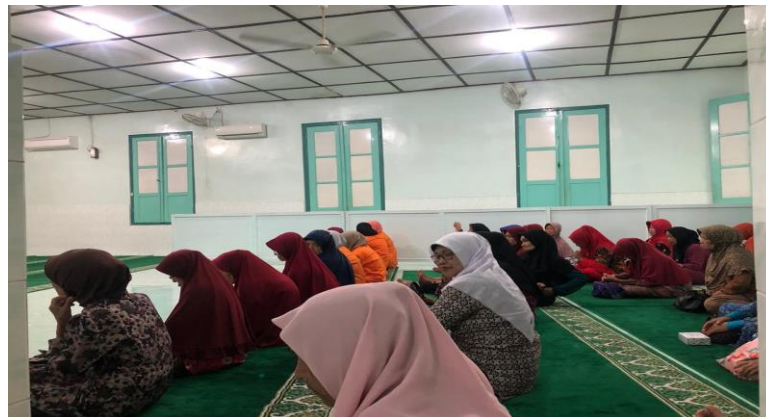
Gambar.1. Pengajian Rutin

Pada sore hari, tepatnya pukul 16:00 WIB, setiap hari Selasa kami mendampingi pengajian rutin. Setiap Senin malam, pendampingan Tahsin Al – Qur'an dan setiap Rabu malam, di Masjid At-Tauhid. Kegiatan pengajian rutin ini memberikan kami sebuah pelajaran berharga yaitu semangat untuk menjalankan ibadah dan selalu berserah diri kepada Sang Pencipta. Masyarakat sekitar RW 03 memiliki beragam kepercayaan dan mereka mampu mengikuti perkembangan zaman serta bersikap toleransi yang tinggi sehingga membuat hidup mereka menjadi tentram dan damai.