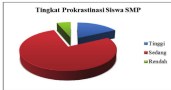
Gambar 1 Tingkat Prokrastinasi Akademik Siswa SMP Muhammadiyah 9 Yogyakarta

9 Temuan penelitian ini sejalan dengan penelitian terdahulu yang telah dilakukan oleh Ferrari, Keane, Wolfe & Beck (1998). Penelitian tersebut menunjukkan sekitar 20% sampai 75% pelajar memiliki masalah prokrastinasi di lingkungan akademiknya. Penelitian ini juga sesuai dengan penelitian yang dilakukan oleh Utaminingsih & Setyabudi (2012) di salah satu SMA Kota Tangerang, yang menunjukkan bahwa 43,70% subjek memiliki tingkat prokrastinasi tinggi dan 56,30% sisanya memiliki prokrastinasi akademik rendah. Selain itu, Penelitian yang dilaksanakan oleh Saputra (2015) menunjukkan bahwa 7,1% siswa menunjukkan prokrastinasi dalam bidang akademik kategori tinggi, 79,8% tergolong sedang, dan sisanya 13,1% tergolong rendah.