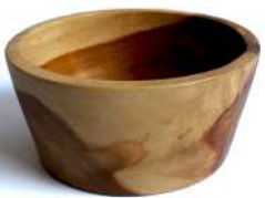
BW - 3