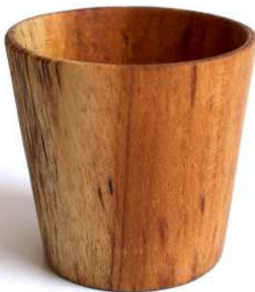
WG - 2