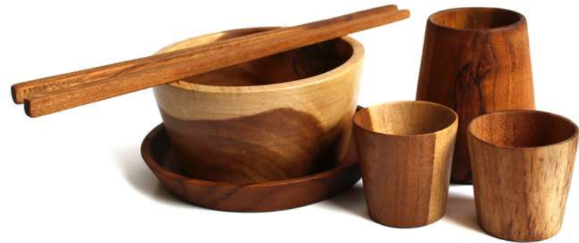
SET - 3