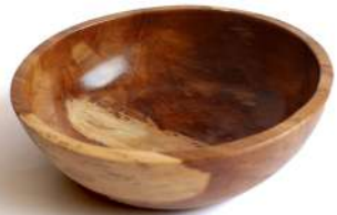
BW - 1