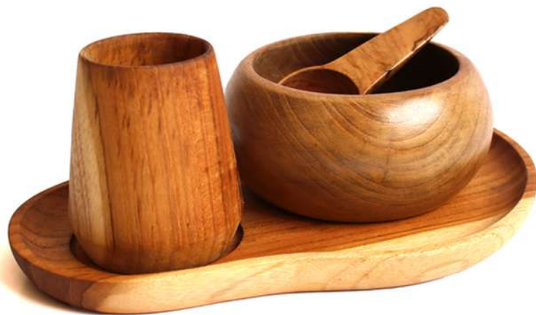
SET - 2