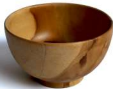
BW - 4