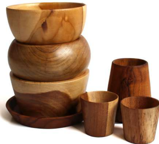
SET - 4