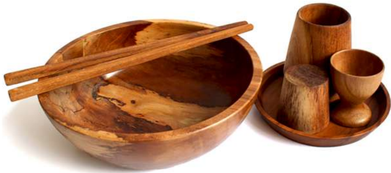
SET - 1