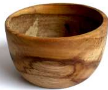
BW - 2