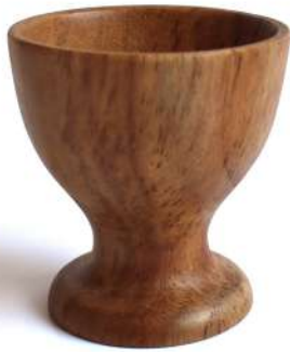
WG - 1