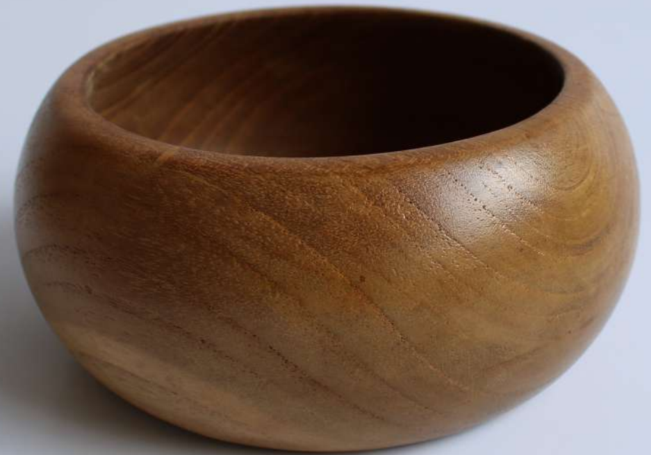
BW - 5