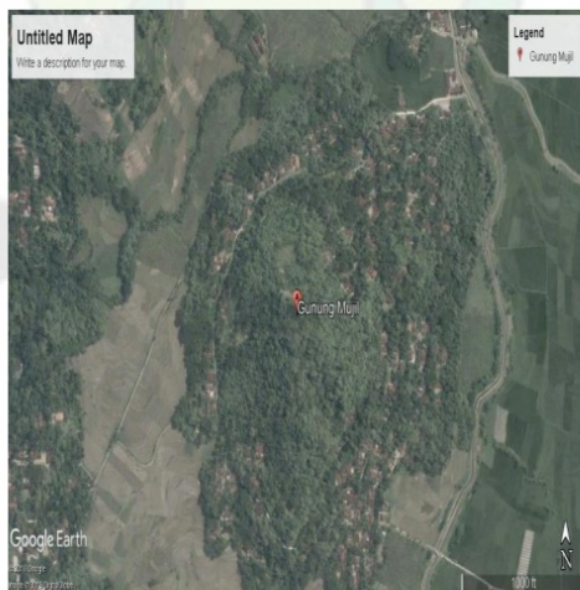
Gambar 2. Peta Lokasi Penelitian di Gunung Mujil Girimulyo.