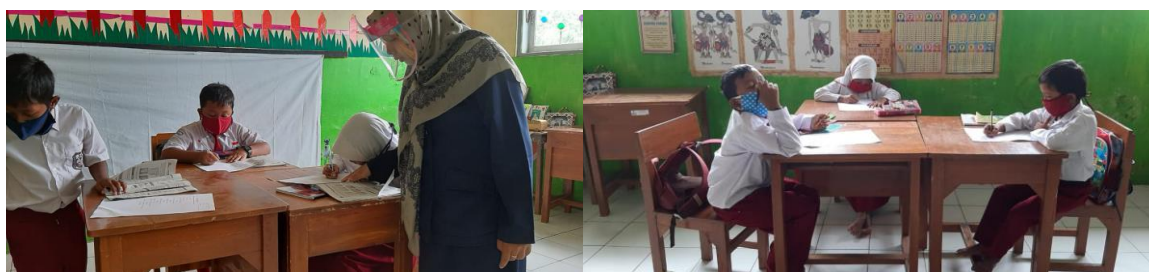
Gambar 1. Kegiatan pembelajaran Luring Siklus I

Masih banyaknya siswa yang belum tuntas dikarenakan sebagian siswa tampak belum terbiasa untuk melakukan kerja dalam kelompok, tingkat ketergantungan pada guru dan teman yang dianggap memiliki pengetahuan lebih masih tinggi sehingga menyebabkan tingkat pemahaman, penguasaan dan menemukan gagasan kurang dilakukan oleh siswa. Siswa kurang terbiasa mencari dan menemukan solusi untuk memecahkan permasalahan yang dihadapinya sehingga kurang komunikatif dan cenderung belajar masih individual mengandalkan teman yang dianggap mempunyai kemampuan lebih.