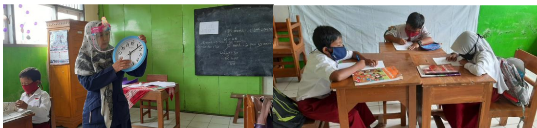
Gambar 2. Kegiatan Luring Siklus II

proses pembelajaran dan refleksi. Hasil belajar berupa perolehan nilai siswa dari tes formatif . Rata-rata hasil belajar siklus II sebesar 80 dengan nilai tertinggi 100 dan nilai terendah 60. Siswa yang mendapat nilai \geq 70 sebanyak 13 dengan prosentase 87% dan siswa yang mendapat nilai dibawah KKM 70 sebanyak 2 dengan prosentase 13%. Meskipun pada siklus II masih terdapat 2 anak yang belum mencapai KKM, nilai rata-rata pada siklus II sebesar 80 telah memenuhi KKM ( 70 ) dan jumlah siswa yang telah memenuhi KKM 70 telah mencapai 87% sesuai dengan kriteria ketuntasan.