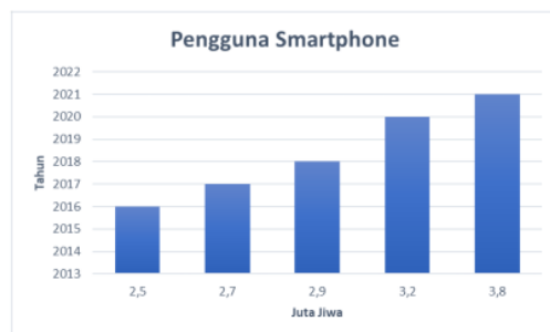
Gambar 1. Penggunaan Smartphone di Dunia

Pada perkembangan revolusi industri 4.0, informasi semakin menunjukkan pengaruh yang besar bagi kehidupan manusia. Kemudahan dalam mengakses informasi sangat penting dengan hadirnya internet sangat membantu baik dari segi pemerintahan, pendidikan, kesehatan maupun pribadi. Internet menyediakan media untuk bersosialisasi, memudahkan urusan pekerjaan, serta menambah market atau pangsa pasar merupakan hal yang saat ini diterapkan [1]. Perkembangan teknologi juga ditandai dengan begitu cepat peningkatan penggunaan smartphone di dunia untuk lebih mempermudah akses informasi dengan cepat, kapan saja dan dimana saja. Menurut survei online yang dilakukan oleh Statista terkait perkembangan pengguna smartphone dapat dilihat pada Gambar 1 [2].