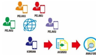
Gambar 4. Simulasi Cyberbullying

group tersebut akan menjadi korban bullying . Simulasi cyberbullying dapat dilihat pada Gambar 4.