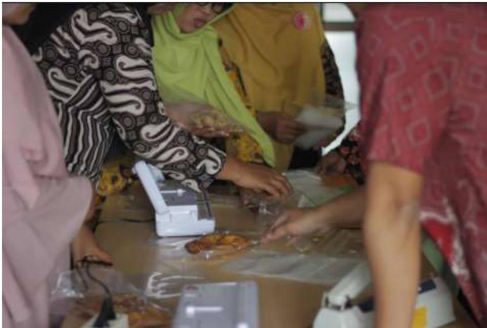
Gambar 5. Peserta Berpartisipasi dalam Pelatihan Pengemasan