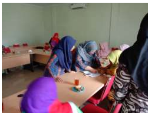
Gambar 4. Pendampingan Tim Bersama Peserta Pelatihan

Pelatihan dilakukan antara peserta dengan didampingi oleh tim PKM dan narasumber (Gambar 4). Peserta diminta untuk menimbang berat produk yang akan dikemas dan memilih contoh bentuk kemasan yang sudah disediakan, antara lain kemasan berbahan aluminium foil, kertas (boks) dan plastik. Setelah itu, peserta diminta mengemas menggunakan vaccum sealer . Setelah pelatihan ada sesi konsultasi dengan narasumber mengenai produk dan kemasan hasil pelatihan peserta.