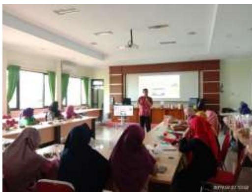
Gambar 3. Pemberian Materi oleh Pemilik CV. Pojok Kemasan Yogyakarta

pembeli. Melalui penjelasan dan diskusi, peserta diberikan materi mengenai jenis-jenis media pembungkus yang dijual di pasaran termasuk contoh jenis produk pangan yang cocok dikemas dengan media tersebut.