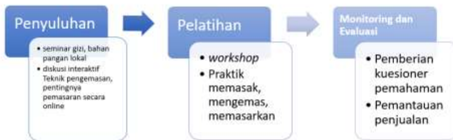
Gambar 2. Tahapan Metode Program Kemitraan Masyarakat

Kegiatan ini juga melibatkan tiga personil mahasiswa dari Teknik Kimia dan Teknik Informatika yang bertindak sebagai asisten pelatihan yang bertanggungjawab terhadap dokumentasi dan pendampingan peserta, dimana manfaat untuk mahasiswa yaitu dapat sekaligus dijadikan kegiatan Kerja Praktik. Seluruh pengisi materi menjalani tahapan yang ditunjukkan dalam Gambar 2 berikut ini: