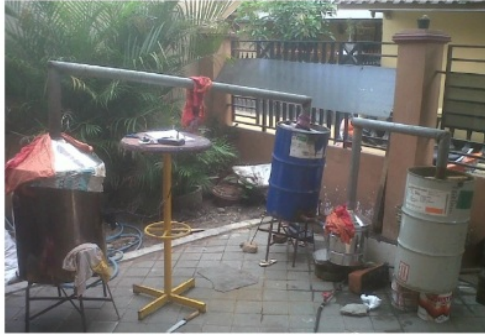
Gambar 2 . Unit alat penghasil asap cair dengan redistilasi