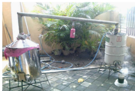
Gambar 1. Alat penghasil asap cair tanpa redistilasi