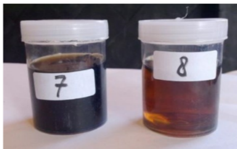
Gambar 2. Asap cair yang dihasilkan dengan redistilasi di tangki Redistilasi( 7) dan hasil dari kondensor 2(8)

2) Perancangan kondensor, luas perpindahan panas kurang maksimal perlu yang lebih besar lagi sehingga bisa mengembunkan lebih banyak lagi asapnya, Destilat yang dihasilkan adalah asap cair grade 3, masih perlu pemurnian lanjut.