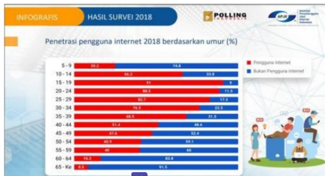
Gambar 2. Data Survei Pengguna Internet Berdasarkan Umur

Hasil survei yang dilakukan oleh APJII (2018) tentang pengguna internet berdasarkan umur dapat digambarkan melalui grafik sebagai berikut (Untari, 2019).