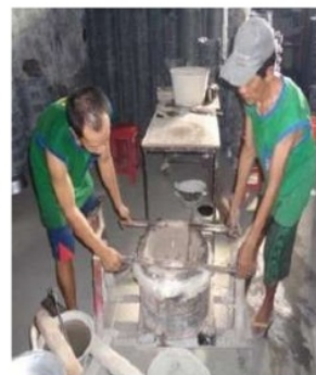
Gambar 2. Sikap kerja mencetak wajan pada Periode 1

Aktivitas mencetak wajan dengan fasilitas kerja cetakan wajan cara lama (Periode 1) dan mencetak wajan dengan fasilitas kerja cetakan setelah perbaikan dengan pendekatan ergonomi (Periode 2), ditunjukkan seperti Gambar 2 dan 3 sebagai berikut.