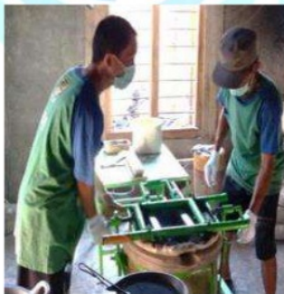
Gambar 3. Sikap kerja mencetak wajan pada Periode 1

p* : Nilai signifikansi berdasarkan Paired Simple t-Test