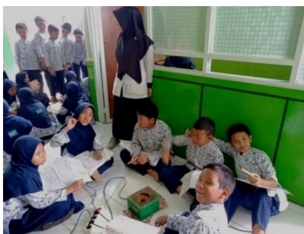
Gambar 3. Peran Guru sebagai Pengelola Kelas pada Kegiatan di Halaman Kelas

diketahui bahwa guru muatan lokal batik tulis mampu membuat peserta didik tertarik untuk mengikuti pembelajaran yang berlangsung dengan cara menggunakan metode pelajaran yang beranekaragam seperti ceramah dan diskusi, serta membantu peserta didik untuk memperoleh suatu hasil belajar yang diharapkan yakni guru mampu membimbing peserta didiknya agar mudah memahami materi pelajaran yang disampaikan serta berusaha mengadakan evaluasi ketika akhir pembelajaran. Guru harus selalu berusaha menyampaikan materi ajar menggunakan bahasa yang mudah dipahami oleh peserta didik (Pontoh, 2013; Sani, 2013). Guru mampu menciptakan proses sosial yang akrab kepada seluruh peserta didik dengan cara mengadakan diskusi pada saat pembelajaran praktik dan berkelompok dalam kegiatan mencanting.