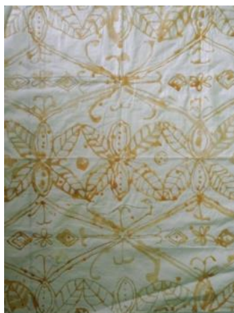
Gambar 2. Contoh Produk Kegiatan Praktik Batik Tulis

dan alat canting. Peserta didik memberikan komponen titik dan garis. Komponen garis yang digunakan oleh peserta didik dalam membuat produk tulis berupa garis tegak lurus, garis lengkung, garis miring, garis sejajar, garis gelombang, garis zig-zag, dan garis spiral. Sedangkan komponen titik digunakan untuk memberikan isen-isen pada ruang yang masih kosong di kain untuk memperindah batik tulis yang telah mereka buat. Akan tetapi, kegiatan praktik membuat produk batik tulis tidak sampai tahap akhir yakni mewarnai kain dikarenakan sekolah lockdown dan libur.