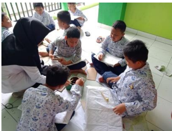
Gambar 1. Peserta didik pada Aspek Proses dalam Kegiatan Praktik Batik Tulis

Dengan adanya semangat dari dalam diri peserta didik dan adanya dorongan dari lingkungannya maka peserta didik mampu menjalankan proses membuat batik tulis secara maksimal yakni dapat diketahui bahwa peserta didik kelas IVA memiliki suatu pribadi yang cenderung ingin tahu dan gemar untuk mencoba suatu yang baru dan menemukan inspirasi mengenai motif batik apa yang akan digunakannya. Proses peserta didik berkegiatan membatik tulis disajikan pada Gambar 1. Hal ini sejalan pula dengan pendapat yang menyatakan bahwa untuk memberikan ruang kreativitas bagi anak-anak, diperlukan konsep sekolah terbuka dan mencoba menerapkan pembelajaran yang membutuhkan perkembangan psikologis siswa mereka (Lian dkk., 2018).