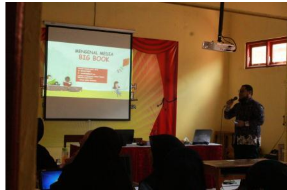
Gambar 4. Pakar media pembelajaran sedang memberikan materi