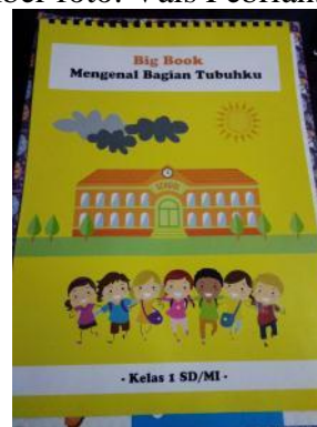
Gambar 6. Salah satu hasil bigbook peserta