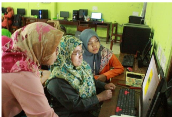
Gambar 5. Pendampingan pembuatan bigbook