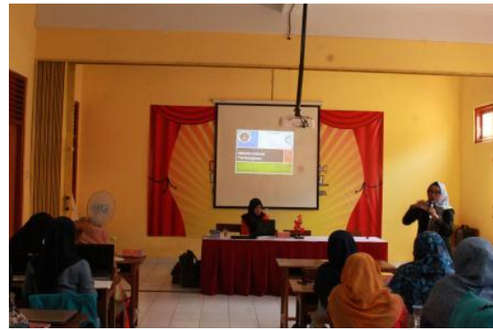
Gambar 2. Trainer 1 sedang memberikan materi