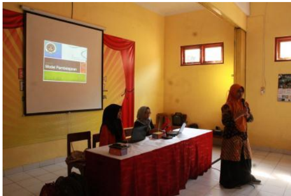
Gambar 3. Trainer 2 sedang memberikan materi (Sumber foto: Vais Febrian, 2019)