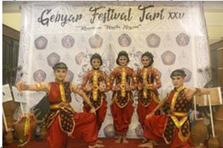
Gambar 3. Penari Laki-laki dan Perempuan dari UAD dalam Acara Festival

tari Islami di perguruan tinggi Islam adalah selalu menggunakan hijab dan manset sebelum menggunakan kostum tarian. Hal ini dimaksudkan agar aurat penari tidak terlihat. Akan tetapi, estetika kostum tari tetap dapat ditampilkan.