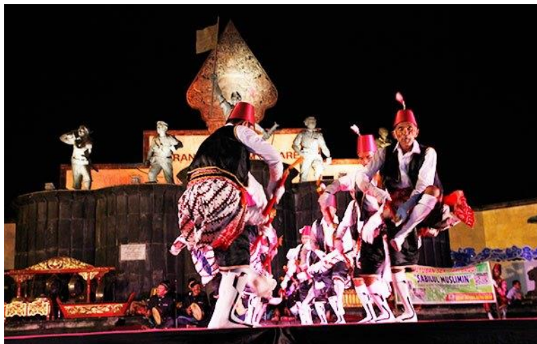
Gambar 2: Tari Badui Sleman Yogyakarta

Lebih jauh dipaparkan oleh Quraish Shihab bahwa seni Islam menyatakan bahwa suatu seni menjadi Islami, jika hasil seni itu mengungkapkan pandangan hidup kaum Muslimin, yaitu konsep tauhid, sedangkan seniman yang membuat objek seninya tidak mesti seorang Muslim (Shihab dalam Rizali, 2012). Pendapat-pendapat tersebut memungkinkan munculnya berbagai bentuk adaptasi seni tari yang mengacu pada konsep Islam. Pada akhirnya tari yang berkembang berfungsi sebagai wahana untuk syiar Islam bagi masyarakatnya. Meskipun bersandingan, namun pengaruh norma dalam Islam menjadi perhatian khusus ketika tari membawa identitas keIslaman. Sebagai contoh adalah tari sufi yang banyak diketahui oleh masyarakat sebagai tari Islami yang menggambarkan ketaatan kita kepada Allah SWT. Pencipta tari sufi yaitu Jalaludin Rumi adalah seorang filsuf Islam, sehingga karya tari yang diciptakan bukan mengacu pada estetika bentuk tari, namun lebih pada estetika Islam yang digambarkan melalui tari. Sebuah penelitian yang dilakukan oleh Aminah Nur Nasution juga menerangkan bahwa di Yogyakarta terdapat tari Badui yang menjadi media dakwah Islam dengan syair-syair yang dinyanyikan adalah puji-pujian terhadap Allah SWT (Nasution, 2017).