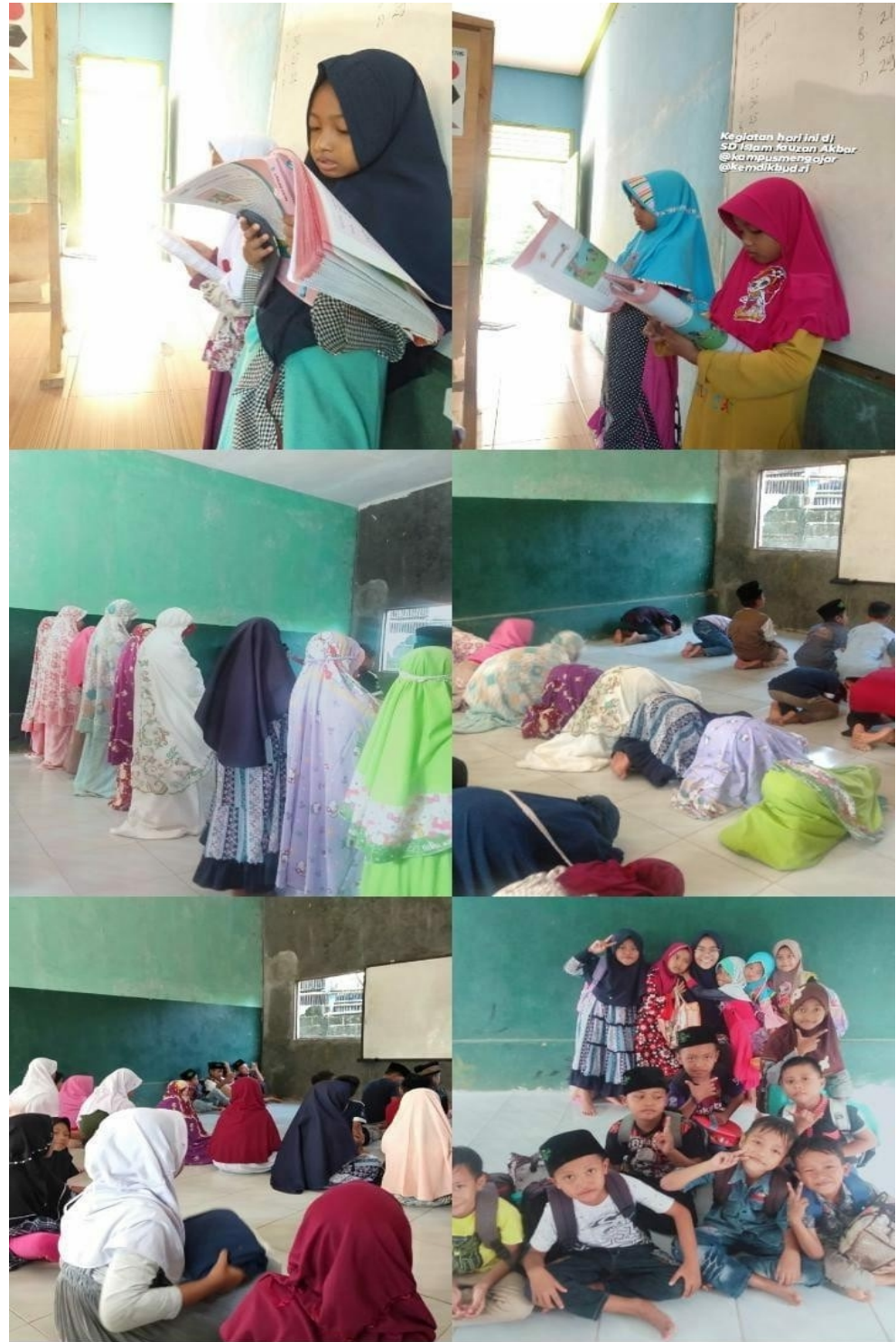
B . belajar tema kelas 1 dan menulis tahsin