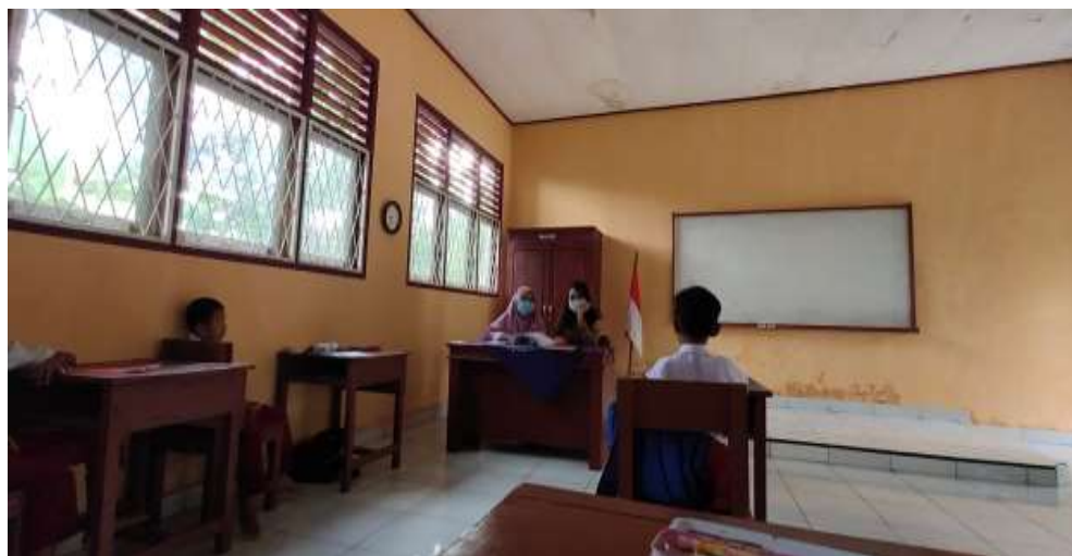
Gambar 1.2 Pendampingan Lest Pray Kelas III SDN Sungai Hitam