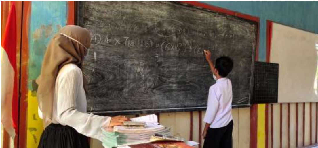
Gambar 2.1 Les Literasi dan Numerasi Kelas VI SDN Sungai Hitam