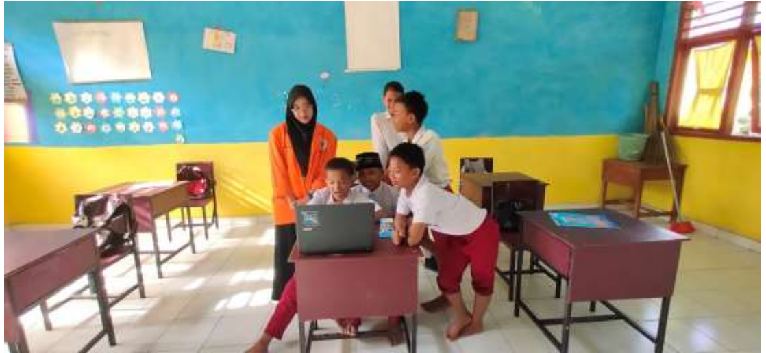
Gambar 2.5 Proses Adaptasi Teknologi di Kelas V SDN Sungai Hitam