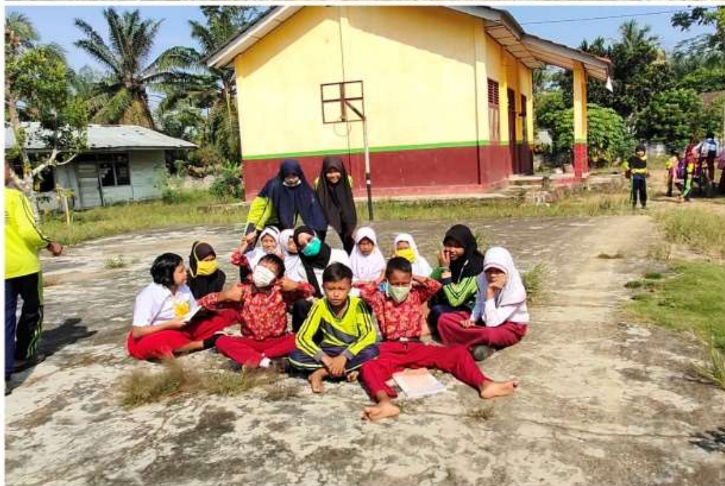
Gambar 1.5 Kelas IV setelah melaksanakan sekolah alam