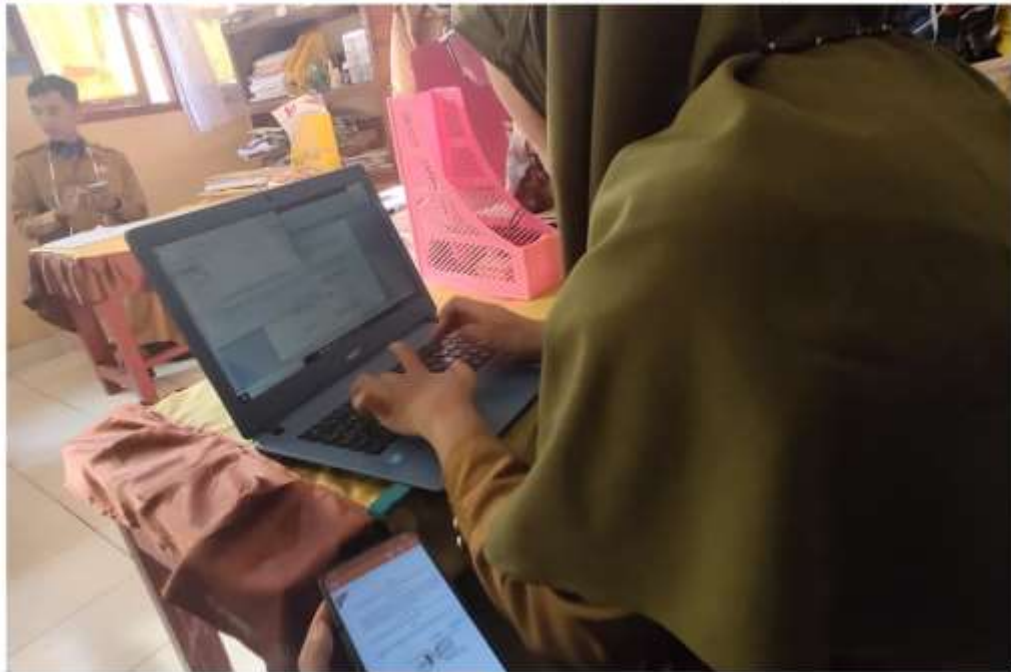
Gambar 4.2 Membantu Operator Sekolah Membuat SK (Surat Ketetapan) Tatap Muka dimasa Covid-19