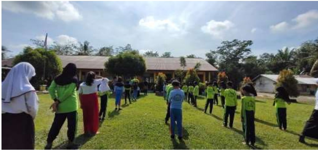
Gambar 1.3 Kegiatan Jumat Bersih dan Sehat