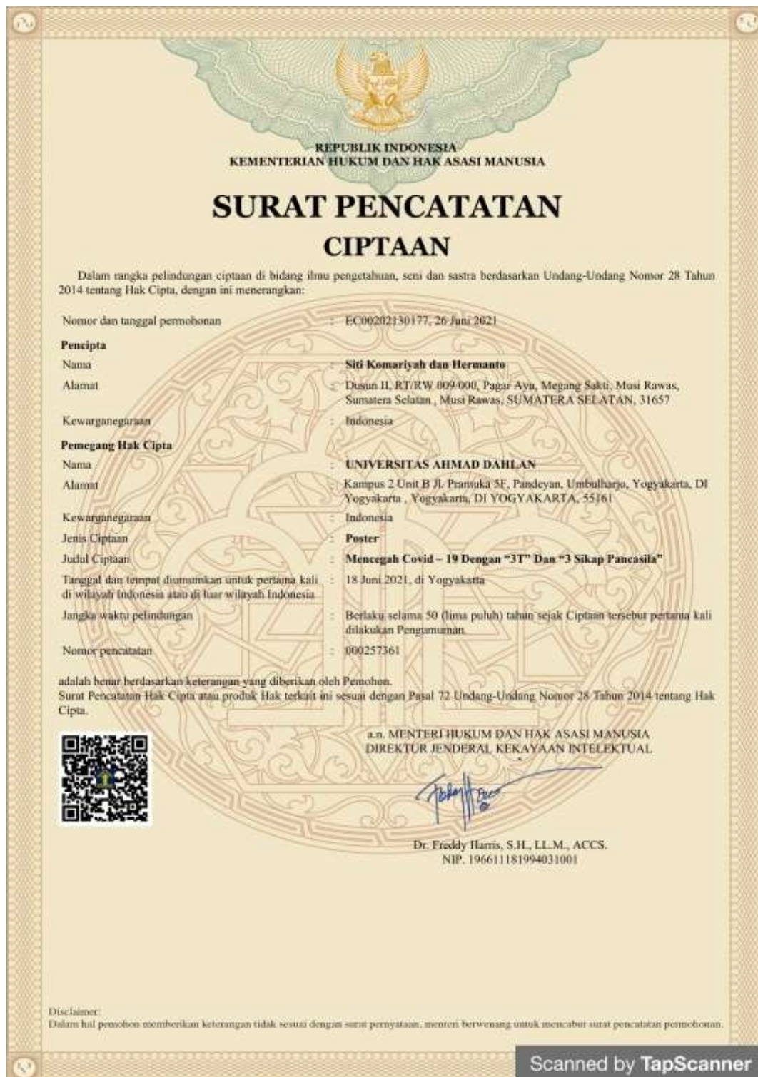
Gambar 4.5 Sertifikat HKI Mencegah Covid-19 dengan “3T” dan “3 Sikap Pancasila”