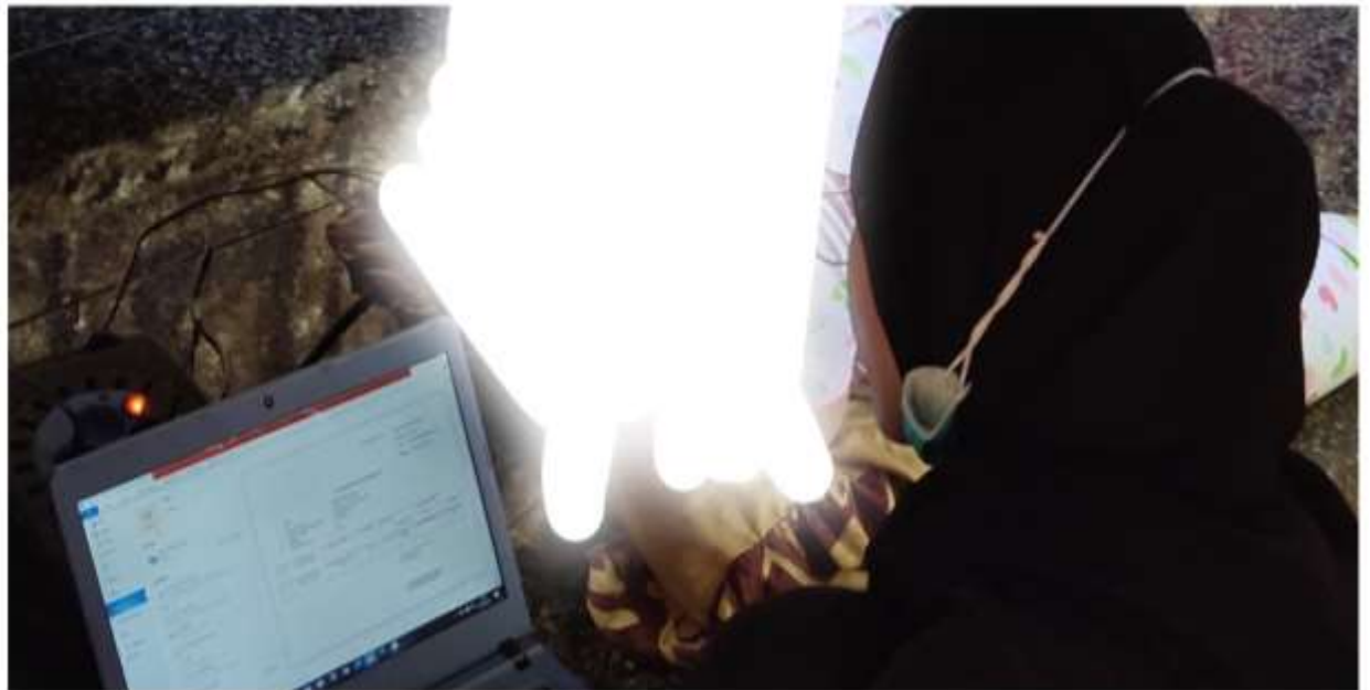
Gambar 3.1 Proses Adaptasi Teknologi Kepada Guru SDN Sungai Hitam ( "Door to Door" )