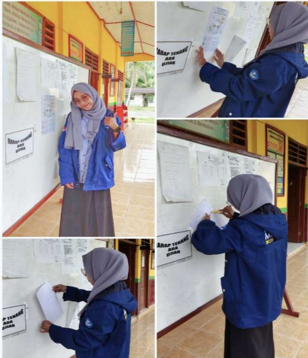
Gambar 4.3 Proses penempelan Poster Mencegah Covid-19 dengan “3T” dan “3 Sikap Pancasila”