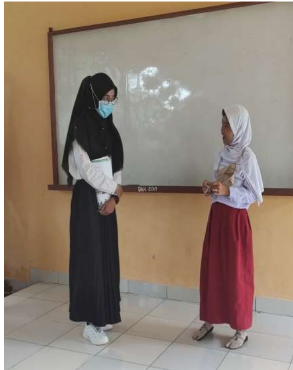
Gambar 1.1 Proses Mengajar di Kelas II SDN Sungai Hitam