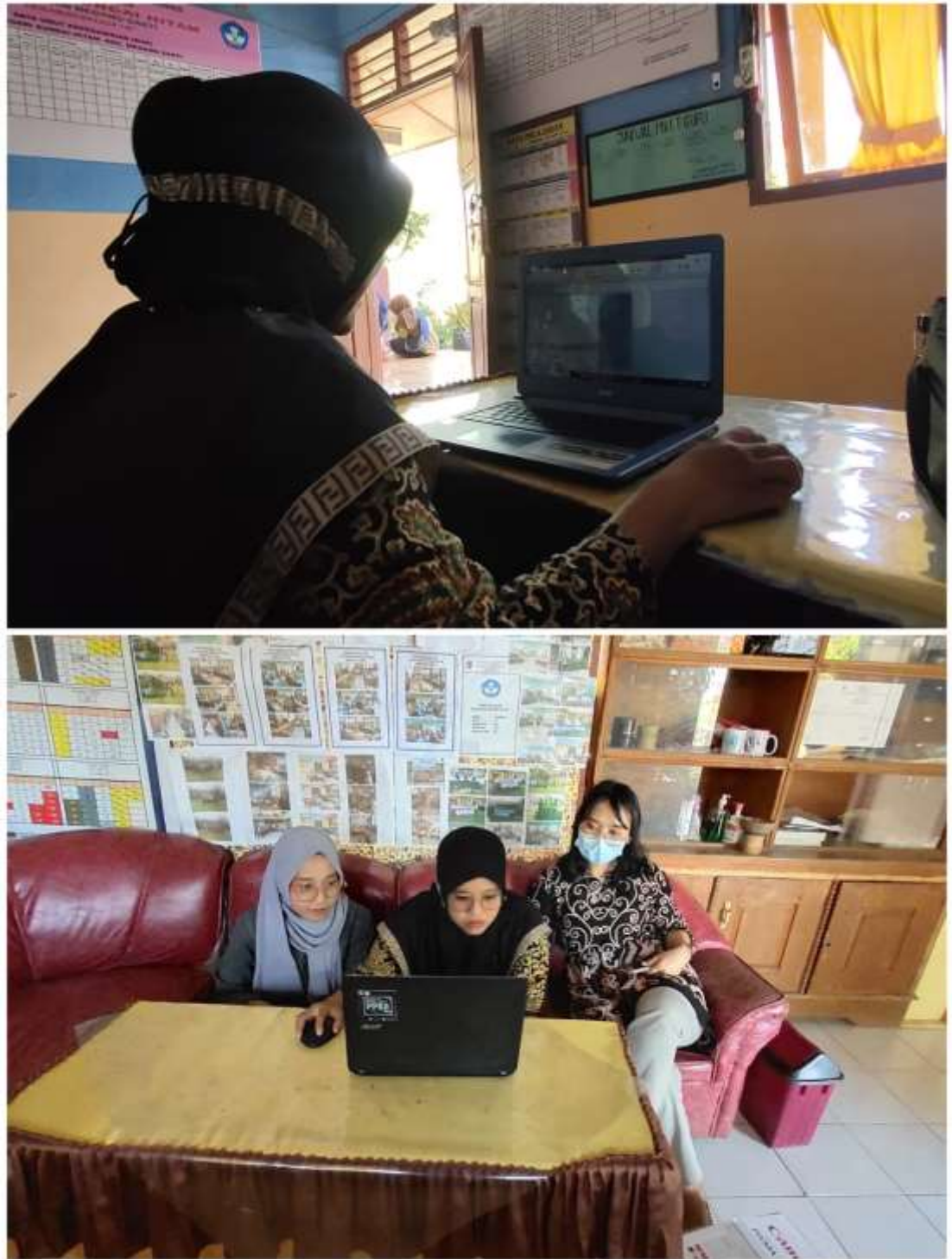
Gambar 3.2 Proses Adaptasi Teknologi Kepada Guru SDN Sungai Hitam