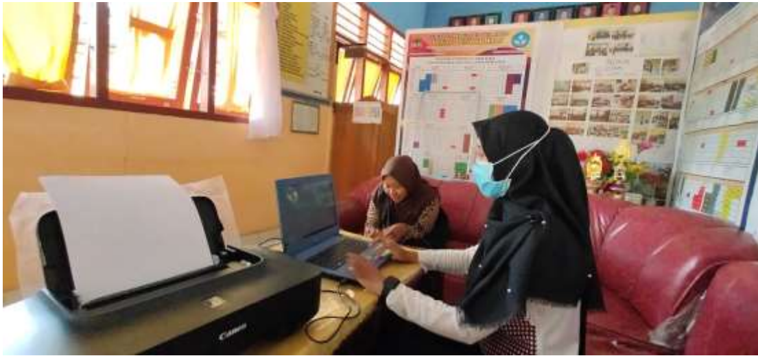
Gambar 3.4 Proses Membuat SK dan Berita Acara untuk Ujian Kelas VI SDN Sungai Hitam