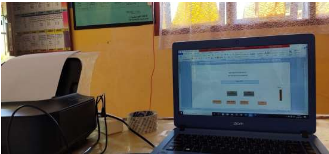
Gambar 3.5 Proses Membuat Denah Ujian Kelas VI SDN Sungai Hitam