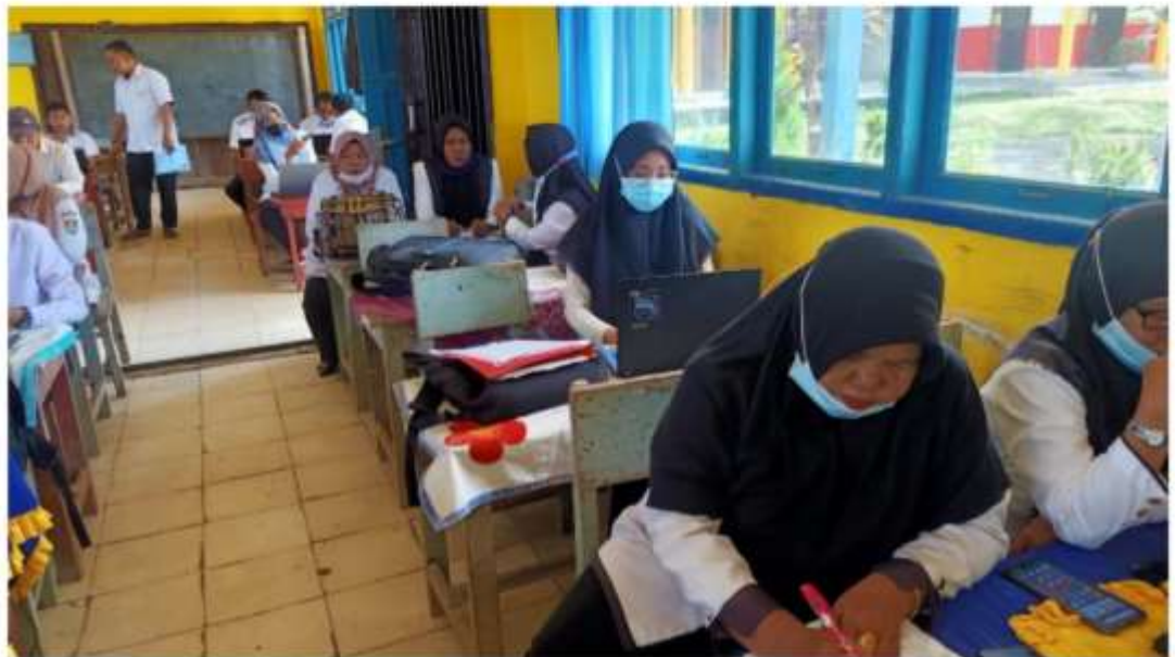
Gambar 3.3 Mengikuti Pelatihan Administrasi Bersama Operator Sekolah di SD 05 Mengang Sakti