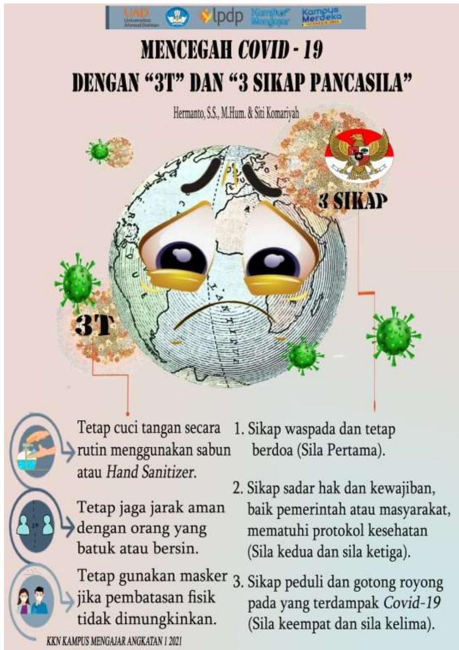
Gambar 4.4 Desain Poster Mencegah Covid-19 dengan “3T” dan “3 Sikap Pancasila”