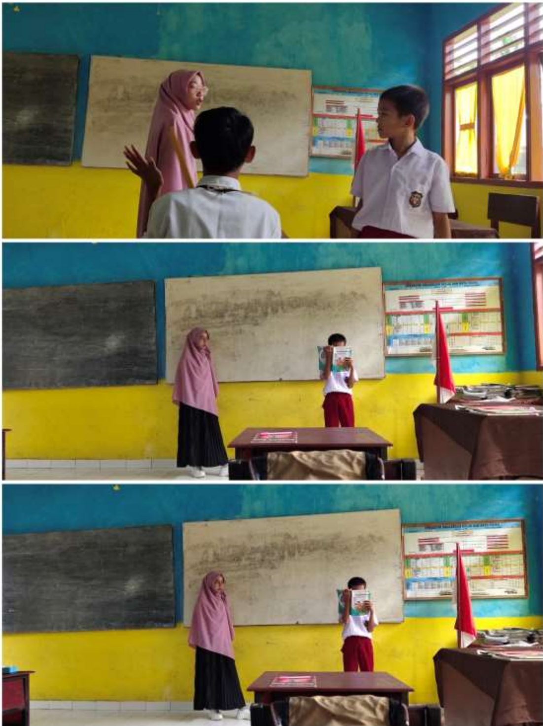
Gambar 2.4 Proses Pembelajaran di Kelas V SDN Sungai Hitam