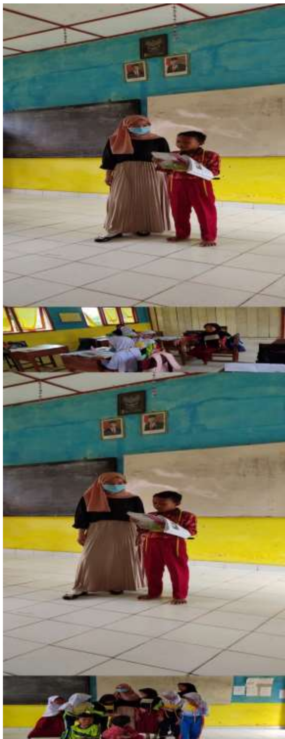
Gambar 2.3 Proses Pembelajaran di Kelas VI SDN Sungai Hitam