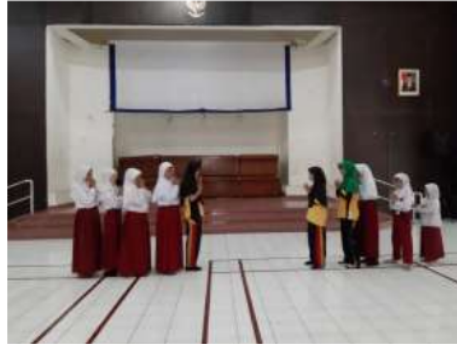
Gambar 1: Pola lantai garis lurus oleh anak tunagrahita

dari anak dengan kategori tunagrahita ringan membentuk teman sejawatnya dengan kategori sedang untuk menempatkan posisinya dengan tepat saat menari.