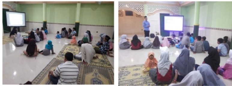
Gambar 2. Dokumentasi Tim Pengabdian TPQ Silastra

Alquran (TPQ) Silastra. Al-Qur`an sebagai pedoman umat Islam telah mengajarkan dan menggambarkan bagaimana pendidikan karakter harus diajarkan kepada anak (F Kh & Mukhlis., 2017). Dalam hal ini tim pengabdian menggunakan kisah-kisah tauladan sebagai penghantar penguatan pendidikan karakter religius (Islam). Hal ini tim pengabdian lakukan mengingat santri juga merupakan seorang siswa di sekolah, dengan demikian TPQ berperan sebagai pendidikan lanjutan bagi siswa. Dalam hasil penelitian sebelumnya, Faizah, dkk. Pendidikan karakter telah diintegrasikan pada mata pelajaran Bahasa Indonesia, IPA dan IPS melalui model pembelajaran terbukti efektif untuk meningkatkan nilai-nilai kejujuran, tanggung jawab, dan ketaatan beribadah, serta hasil belajar IPA/IPS (Faizah, dkk dalam Zuhdi.Faizah, 2010).