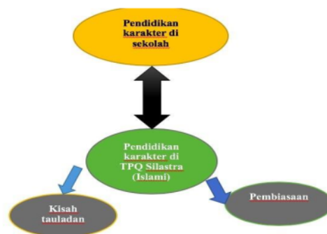
Gambar 3. pola pendidikan karakter religius di Taman Pendidikan Alquran (TPA ) Silastra

Demi kontinuitas penguatan peran TPQ dalam pendidikan karakter religius (Islam) tim pengabdian melakukan pendampingan kurikulum di Taman Pendidikan Alquran (TPA) Silastra. Kurikulum dan pembelajaran merupakan bagian penting (Fujiawati., 2016). Kurikulum yang di kembangkan selain merangkum kegiatan utama pembelajaran Al-Quran, juga menerapkan penguatan karakter religius (Islam) melalui habituasi. Pengembangan kurikulum ini dengan memperhatikan fleksibilitas, relevansi, efektivitas, efisiensi, keberlangsungan. Adapun skema pola pendidikan karakter religius di Taman Pendidikan Alquran (TPA) Silastra adalah sebagai berikut: