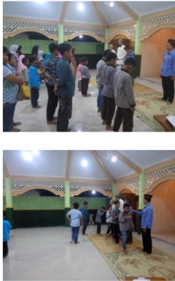
Gambar 4. Habituasi Pendidikan Karakter Religius (Islam) Di Taman Pendidikan Alquran (TPQ) Silastra