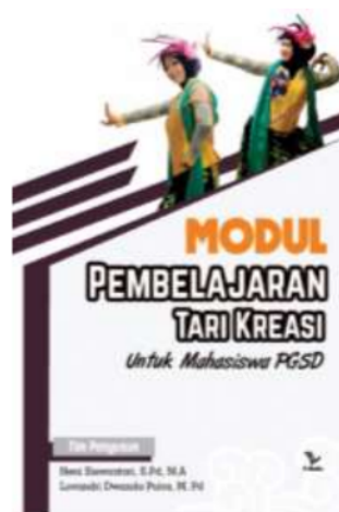
Gambar 1: Cover Modul

Tahap kedua adalah perencanaan produk yang dilakukan yaitu membuat komponen-komponen yang diinginkan dan mendesain produk. Sebelum desain produk dilakukan peneliti terlebih dahulu membuat desain flowchart yang digunakan sebagai acuan dalam mendesain produk agar lebih mudah dan terarah. Berikut adalah beberapa isi dalam modul.