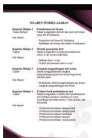
Gambar 2: Silabus dalam modul

Cover modul dibuat sederhana yang memuat gambar 2 orang menari sebagai penciri mata kuliah, judul modul, penyusun, dan penerbit.