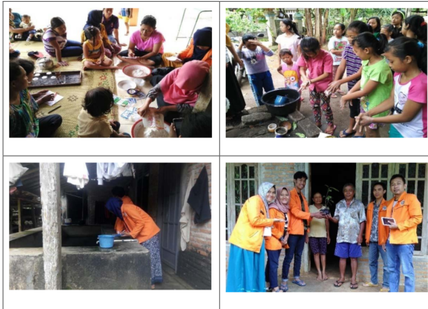
Gambar 3. Aktifitas mahasiswa KKN

Berdasarkan gambar, terlihat program KKN di tiga padukuhan dapat terlaksana. Partisipasi masyarakat cukup tinggi, dengan kata lain dapat memperdayakan masyarakat melalui program-program yang telah dilaksanakan. Program kegiatan tersebut diharap pula meningkatkan potensi wilayah di tiga padukuhan, Palgading, Temuireng, dan Trenggulun, serta mampu menjahterakan kesehatan masyarakat. Dampak dari kegiatan KKN ini adalah: 1) tercipta kesadaran masyarakat sasaran tentang pentingnya PHBS, 2) peningkatan pengetahuan masyarakat mengenai penyakit Demam Berdarah, 3) masyarakat terampil membuat karya bunga dari daun pandan, 4) tersedianya jenis tanaman lain seperti Kakao, 5) Masyarakat terampil memanfaatkan potensi wilayah seperti singkong untuk dijadikan mocaf, kemudian diolah menjadi panganan lain.