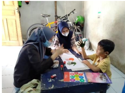
Kegiatan mengajar siswa kelas 1