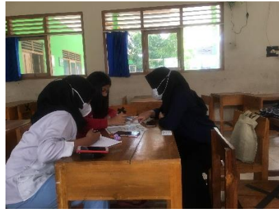
Kegiatan mengajar siswa kelas 6