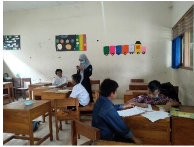
Kegiatan mengajar siswa kelas 5