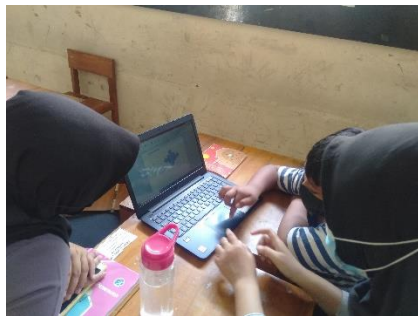
Mengenalkan fitur-fitur sederhana pada Microsoft Word