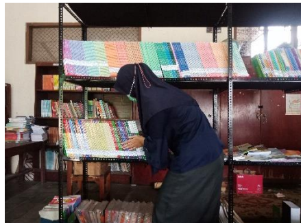
Penataan buku perpustakaan di rak