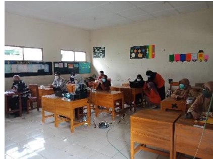
Pelatihan aplikasi AKSI pada guru