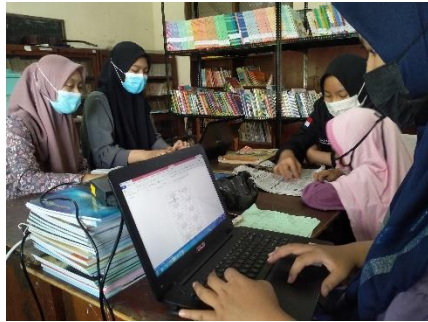
Pembuatan label buku berdasarkan katalog yang sudah dibuat