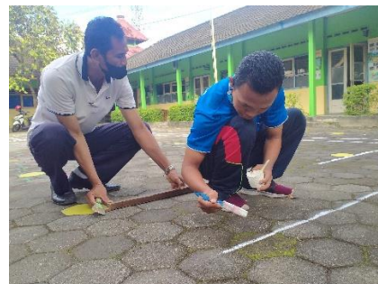
Pemeliharaan lapangan sekolah