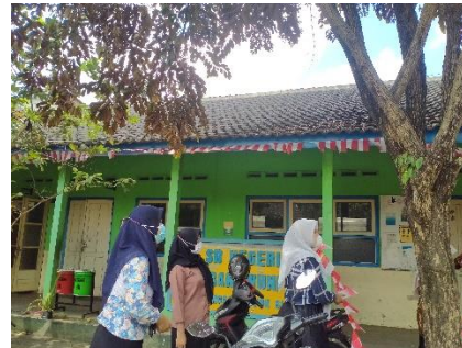
Menghias sekolah untuk persiapan Hari Kemerdekaan RI Ke-76