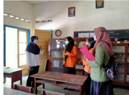
Observasi lingkungan sekolah