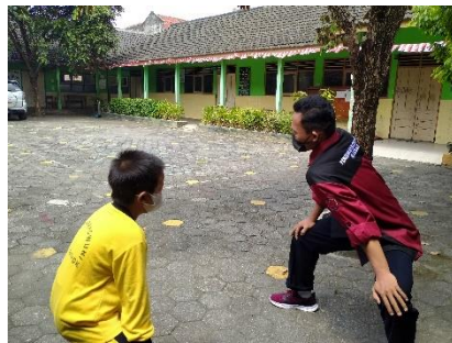
Mengajar olahraga pada siswa