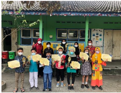
Pemenang lomba HUT SDN Karangwuni