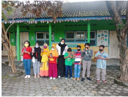
Praktek menanam hidroponik pada siswa kelas 4