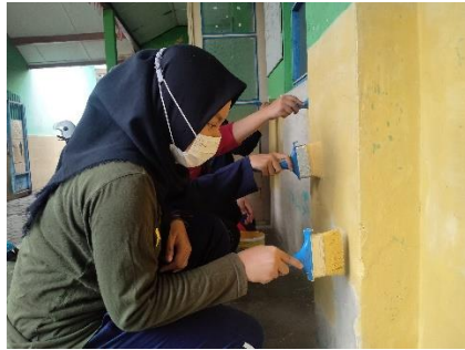
Pemeliharaan gedung sekolah