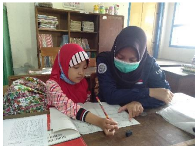
Kegiatan mengajar siswa kelas 3