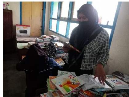
Pembuatan kode atau katalog buku