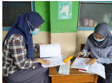
Pengisian buku induk siswa