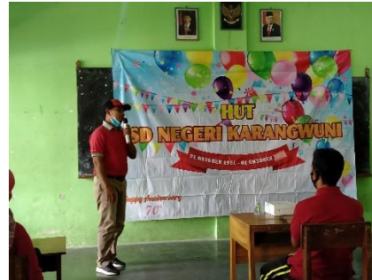
Peringatan HUT SDN Karangwuni