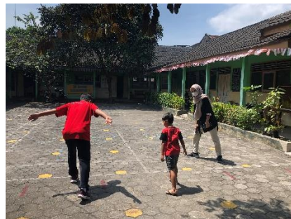
Mengenalkan permainan tradisional pada siswa