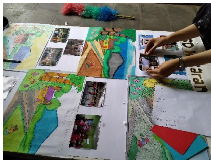
Membuat mading sekolah