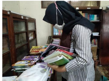
Penyortiran buku yang sudah dilabel