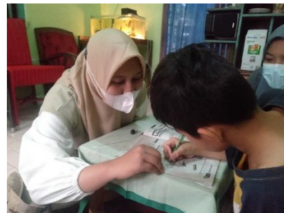
Kegiatan mengajar siswa kelas 4