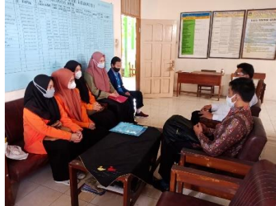
Kunjungan dan pertemuan dengan kepala sekolah