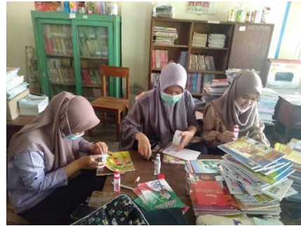
Penempelan label pada buku perpustakaan yang sudah didata