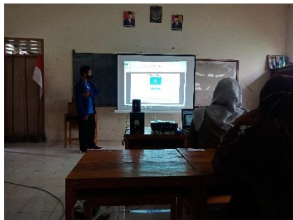
Sosialisasi dan praktek penggunaan media Quizizz