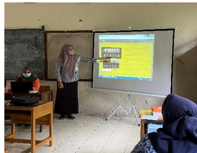
Sosialisasi dan praktek penggunaan aplikasi VN ( editing video )