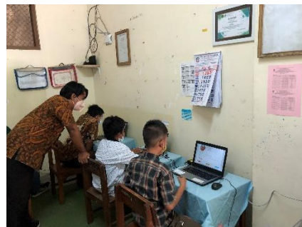
Pelaksanaan Assesmen Nasional Berbasis Komputer