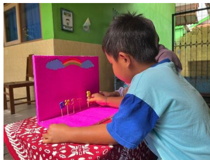
Mengajarkan literasi dan numerasi pada siswa menggunakan media pembelajaran sederhana