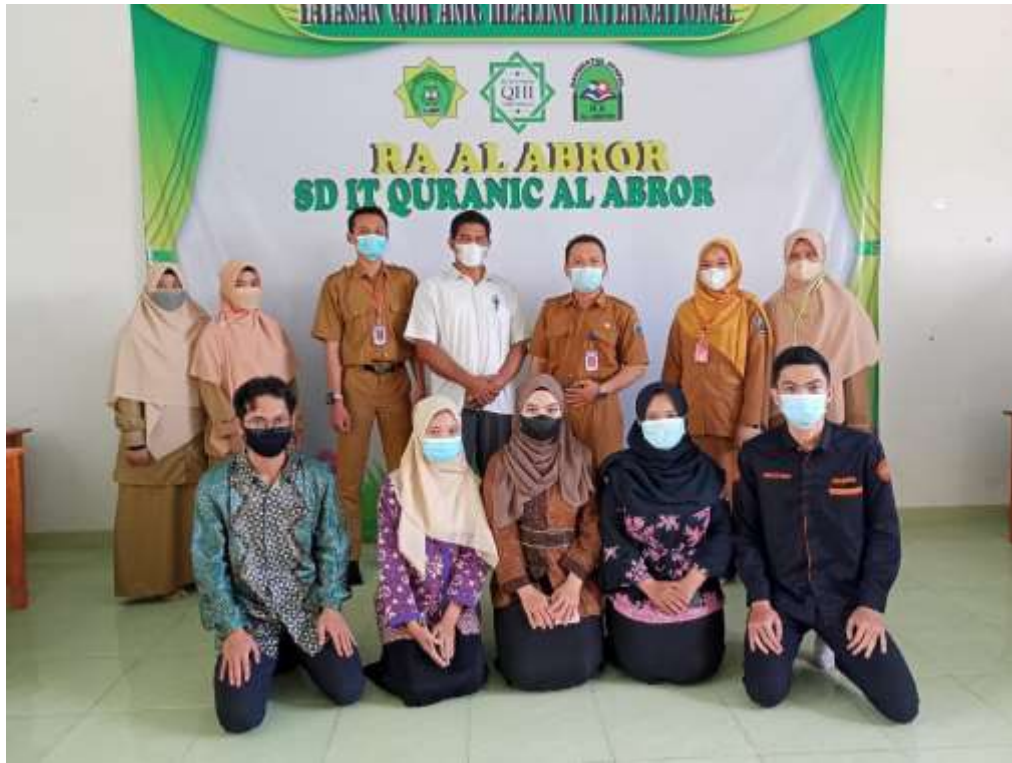
Gambar 23. Menyambut pihak pengawas LPMP