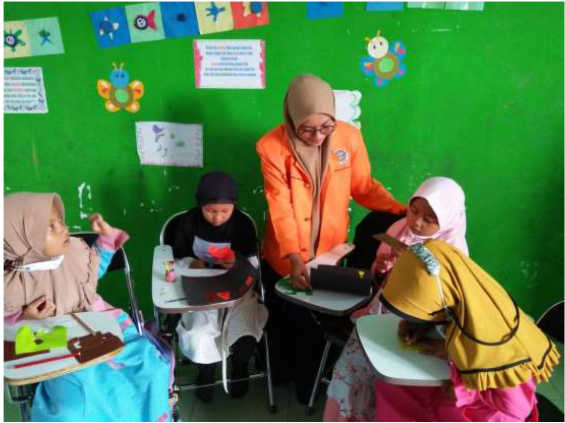
Gambar 25. Mengajar literasi dan numerasi kelas 1, 2 dan 3