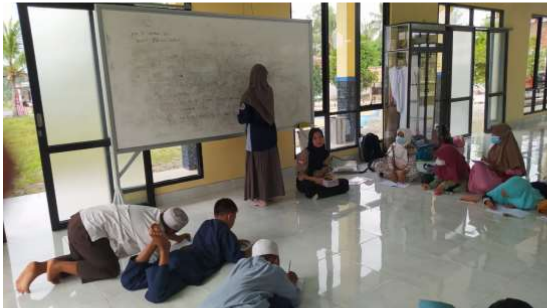
Gambar 12. Mengajar siswa/ kelas 5