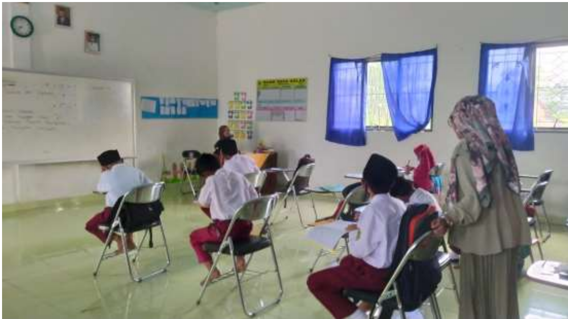
Gambar 32. Mengajar mata pelajaran Bahasa Indonesia kelas 4