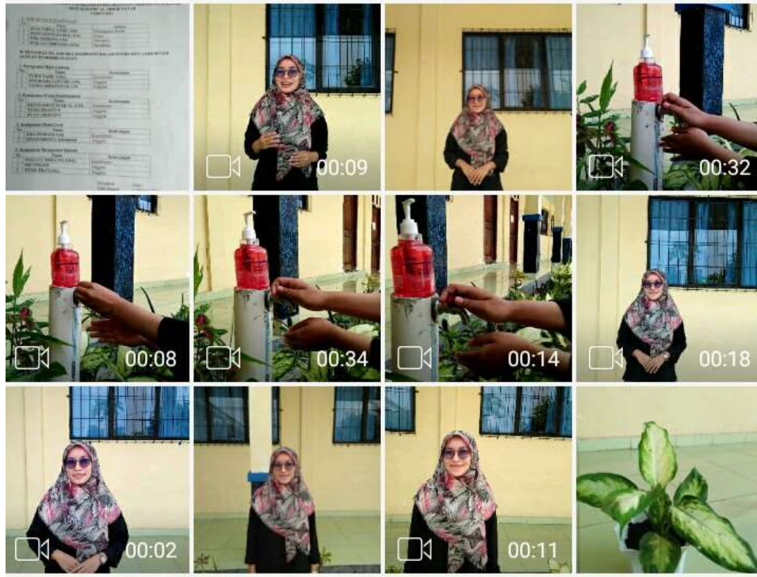
Gambar 11. Membuat video Langkah-langkah cuci tangan