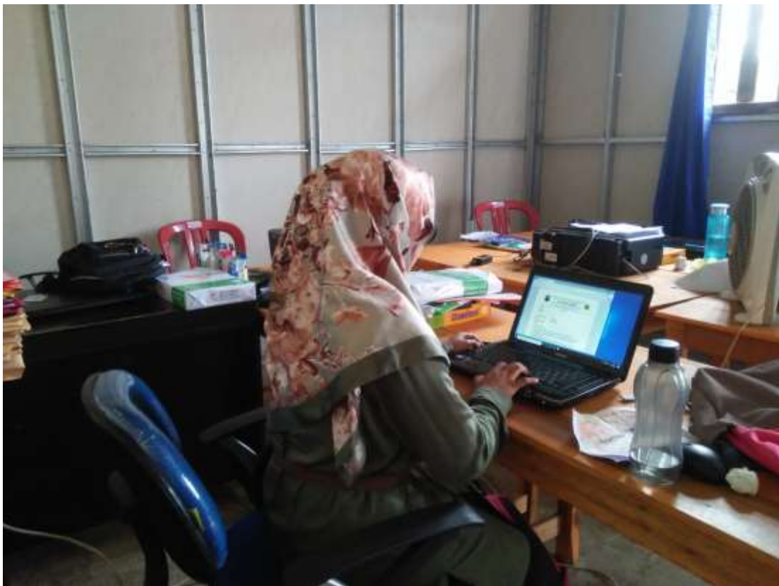
Gambar 2. Mengecek soal-soal untuk PTS