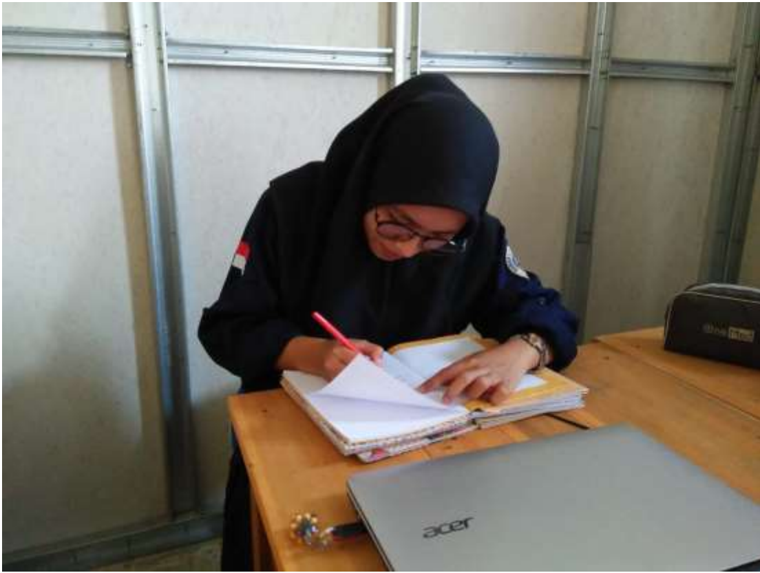
Gambar 7. Membantu mengoreksi tugas peserta didik