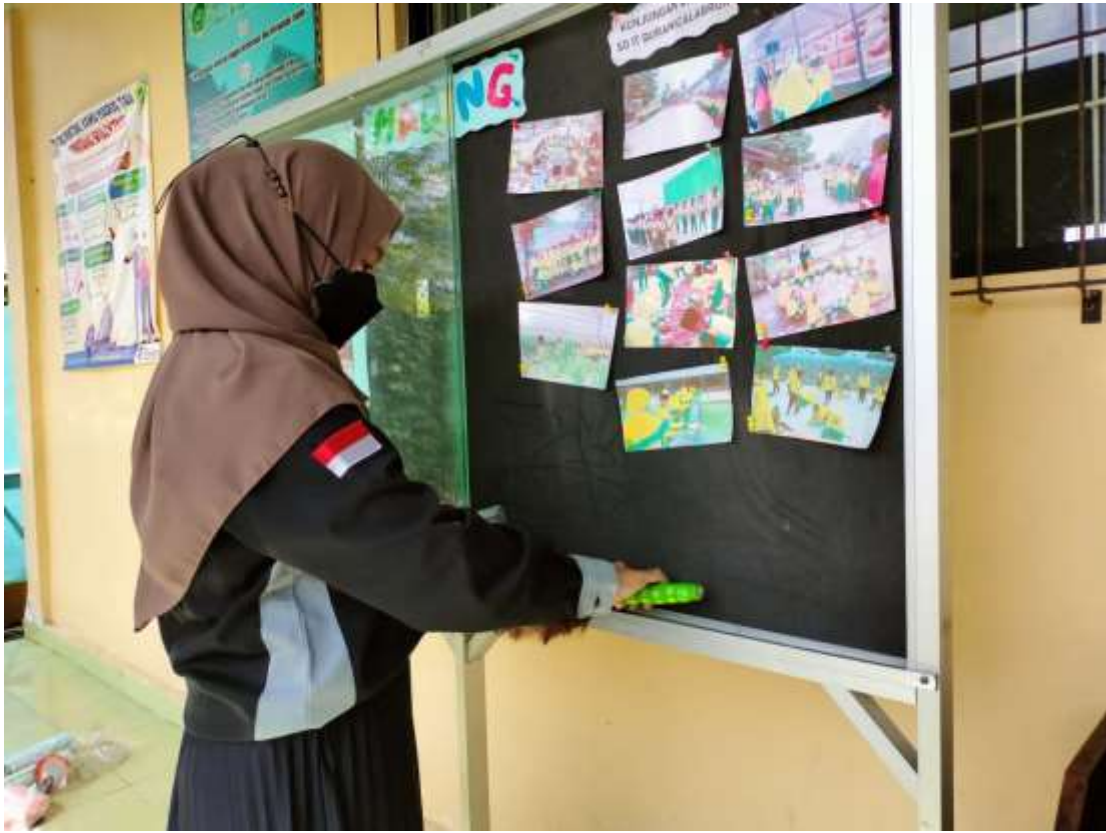
Gambar 31. Menghias Majalah Dinding