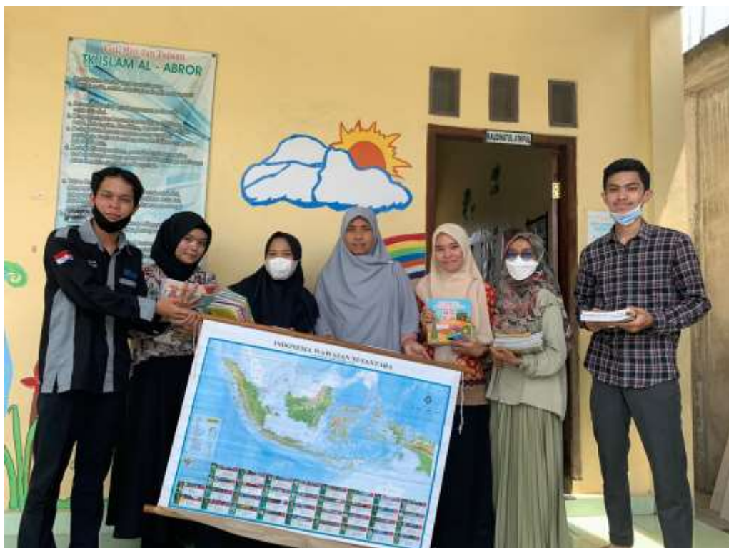
Gambar 36. Pemberian peta Indonesia dan buku kepada pihak sekolah