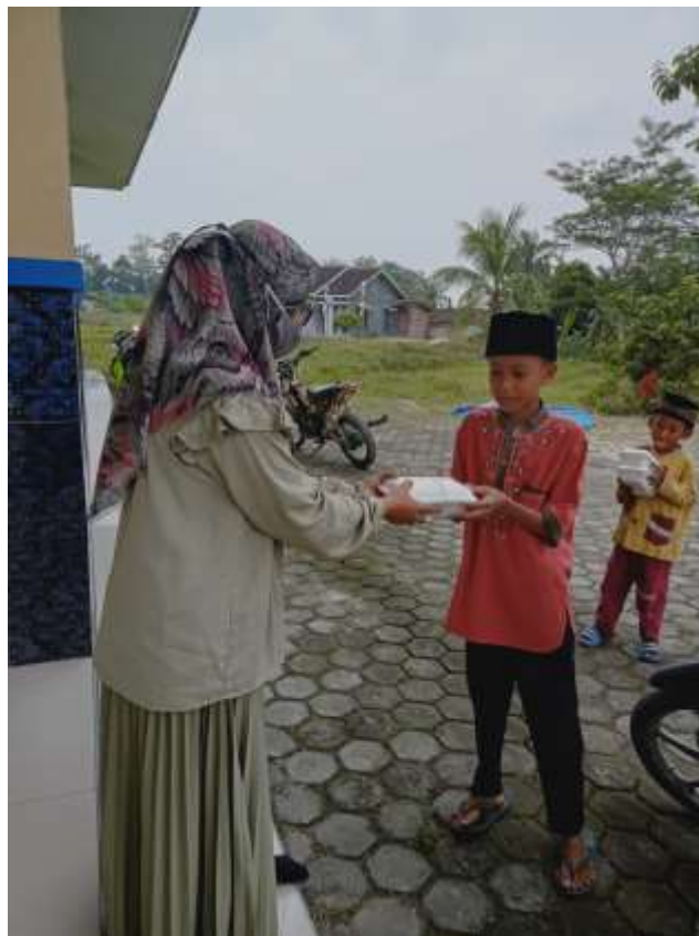
Gambar 10. Jumat berbagi nasi kotak