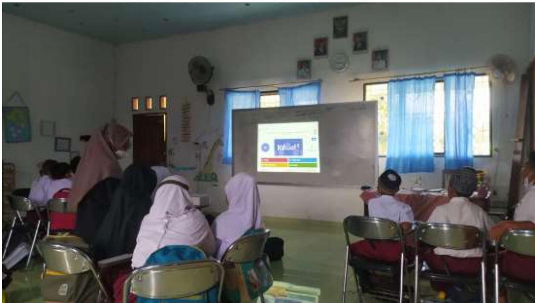
Gambar 28. Menerapkan aplikasi Kahoot