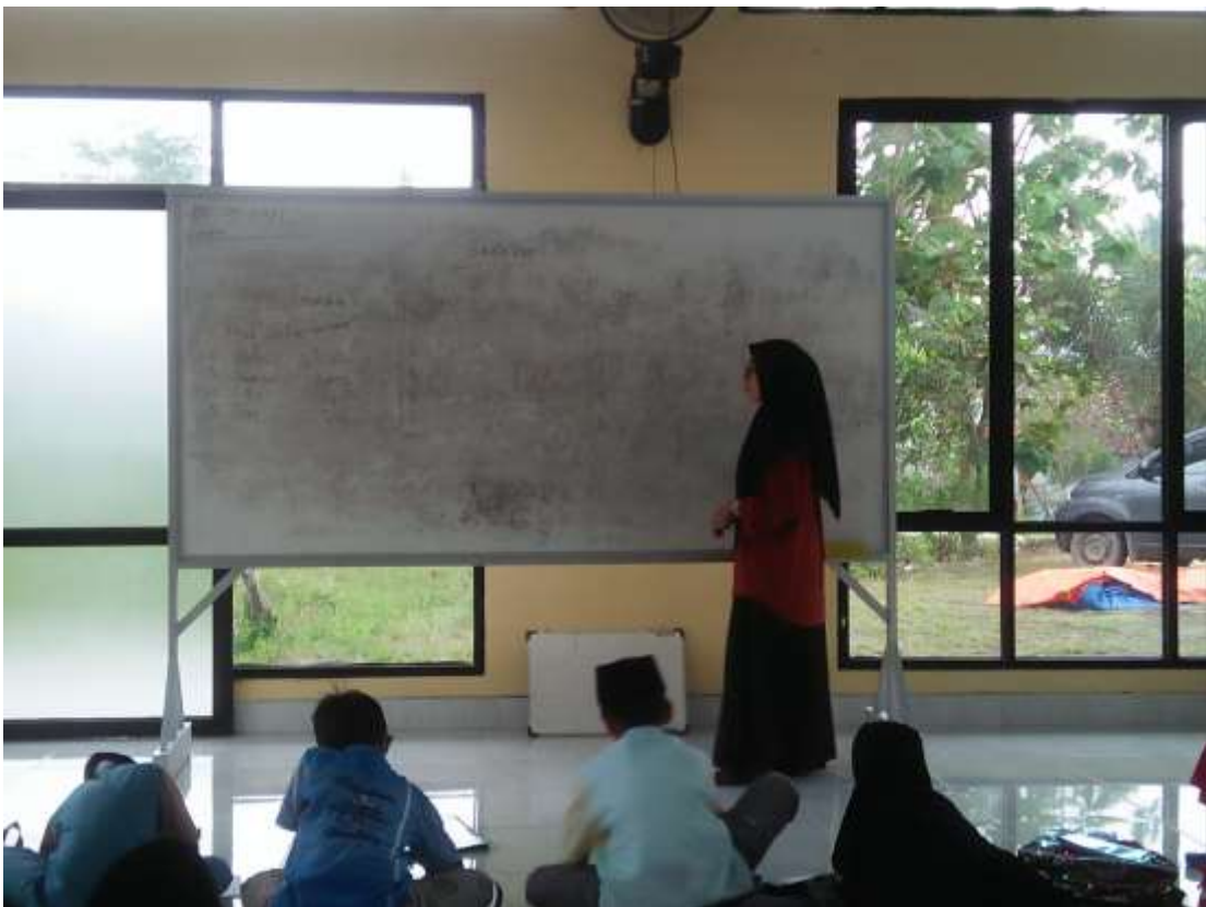
Gambar 14. Mengajar mata pelajaran Bahasa Inggris siswa/l kelas 3