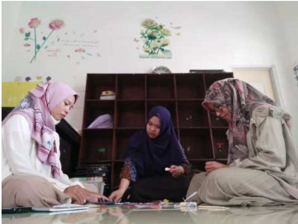
Gambar 9. Membuat media pembelajaran