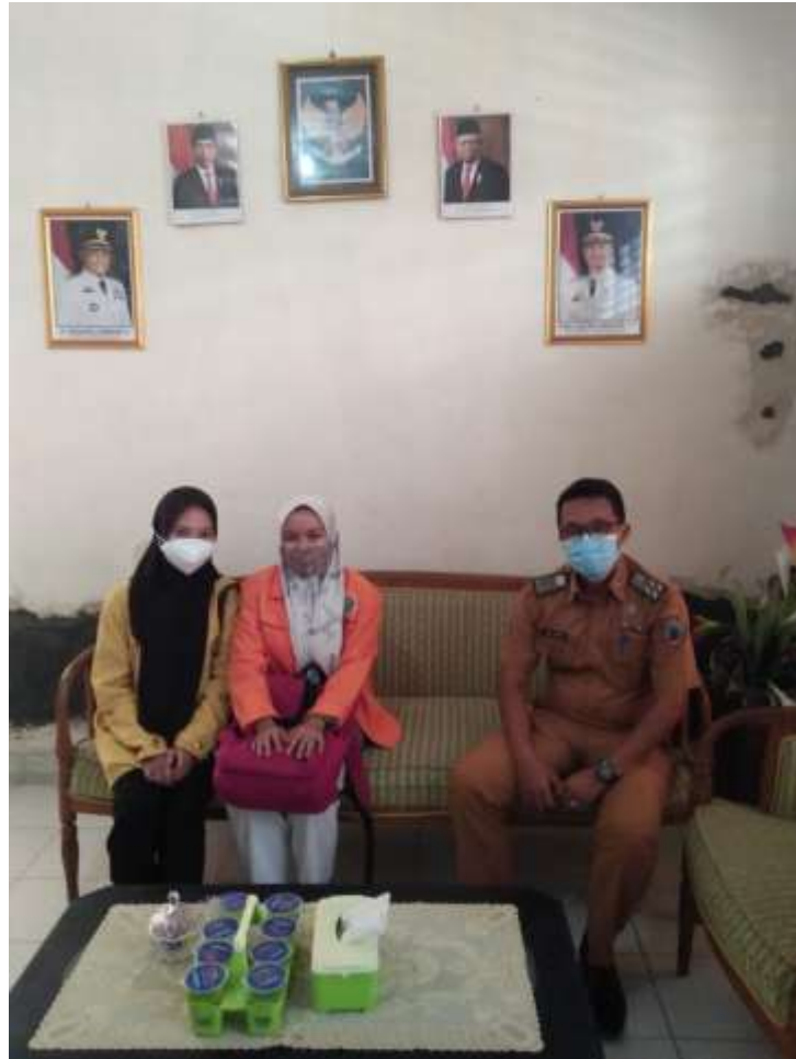
Gambar 1. Pengajuan perpindahan sekolah dari SD N 3 Cintamulya ke SD IT Quranic Al-Abror