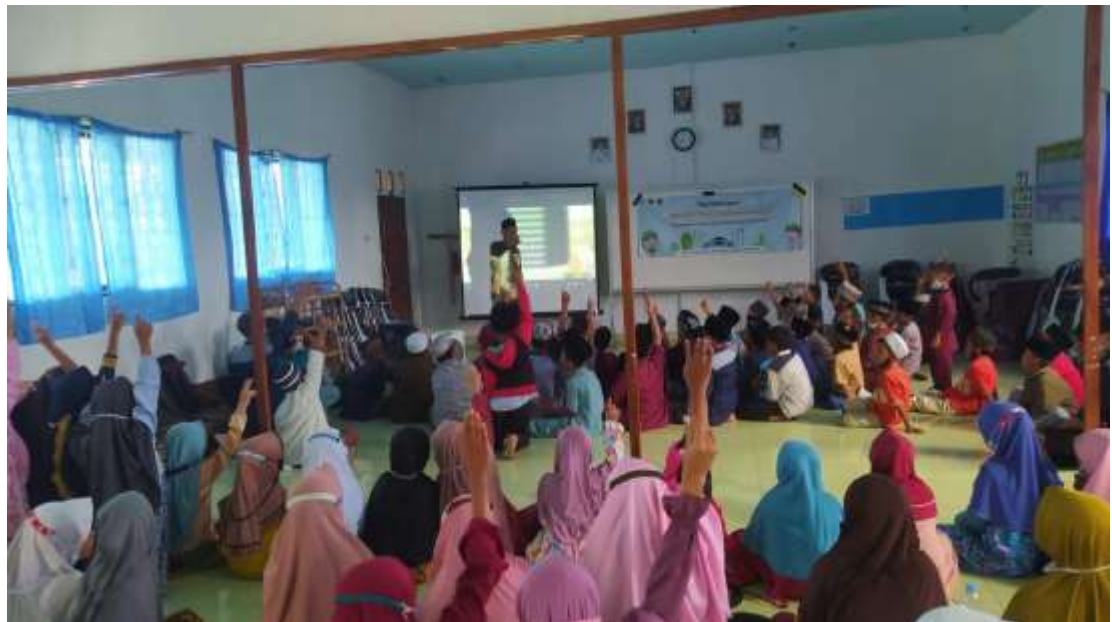
Gambar 26. Merayakan Maulid Nabi SAW