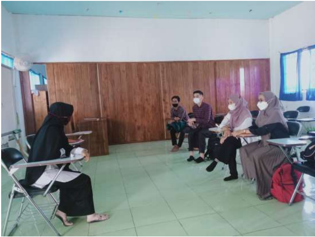
Gambar 2. Perkenalan mahasiswa/i Kampus Mengajar Angkatan 2 kepada pihak sekolah perpindahan sekolah dari SD N 3 Cintamulya ke