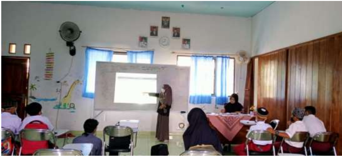
Gambar 29. Menerapkan Power Point dalam pembelajaran