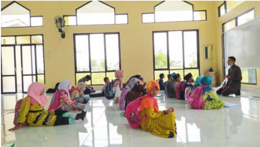
Gambar 15. Mendampingi guru mengajar Bahasa Arab siswa/ kelas 3