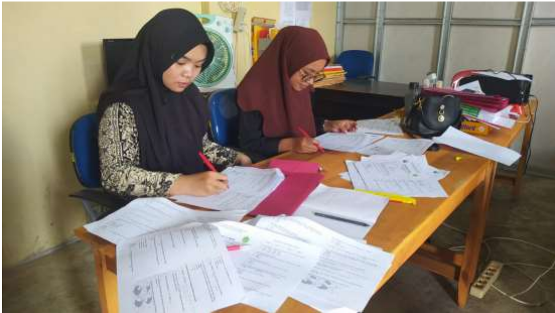
Gambar 17. Mengoreksi hasil PTS peserta didik