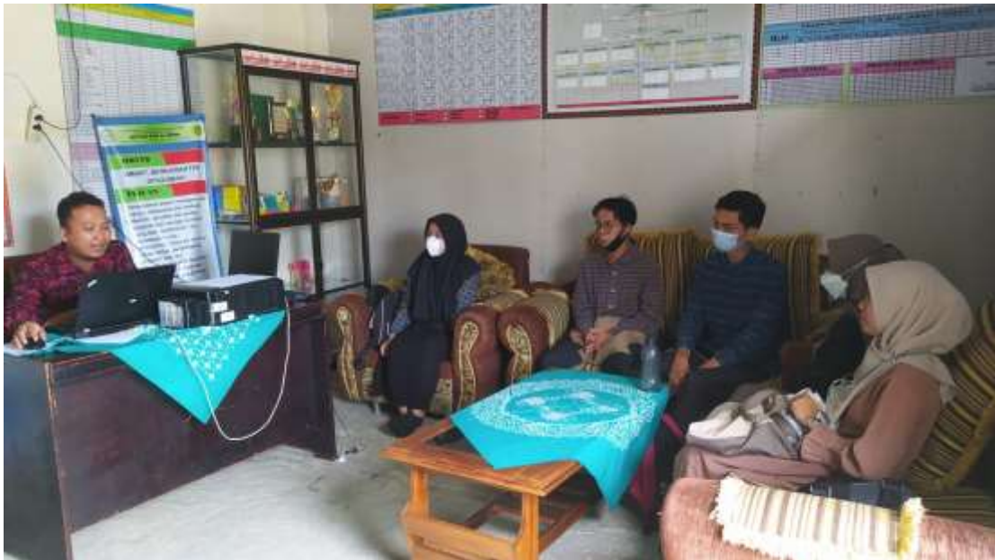
Gambar 34. Diskusi bersama kepala sekolah terkait penarikan mahasiswa Kampus Mengajar