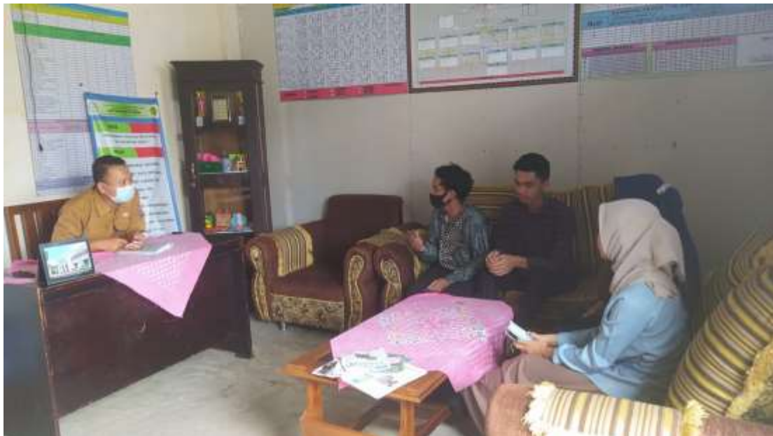
Gambar 8. Berdiskusi dengan kepala sekolah terkait penyusunan