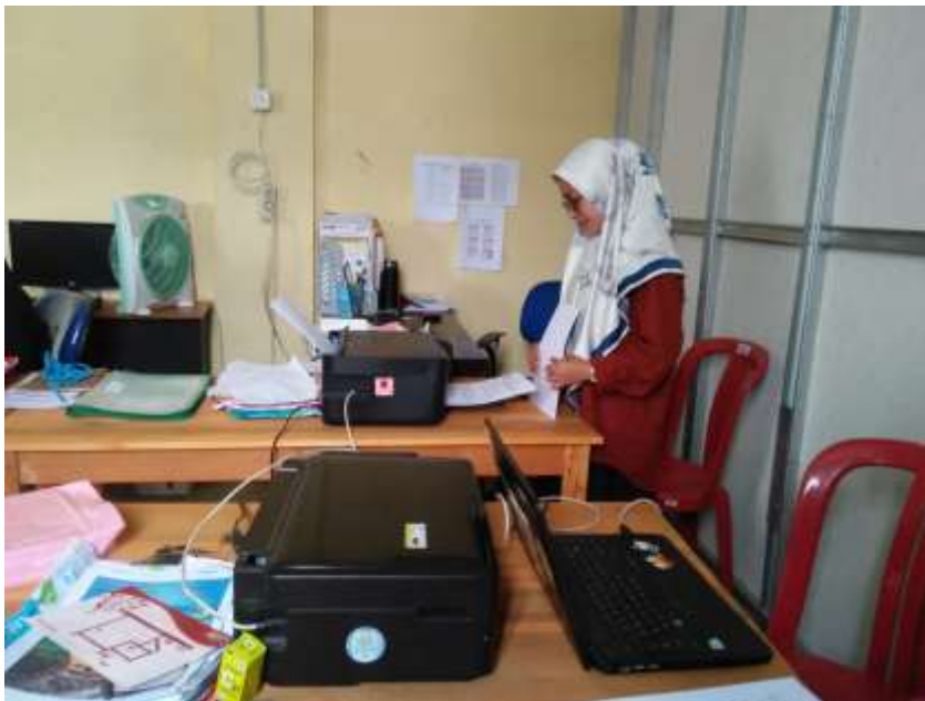
Gambar 6. Membantu rint soal PTS