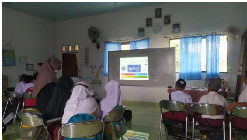
Gambar 2. Penerapan aplikasi Kahoot