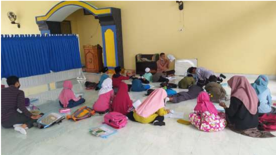
Gambar 13. Mendampingi guru mengajar Bahasa Indonesia siswa/l kelas 3