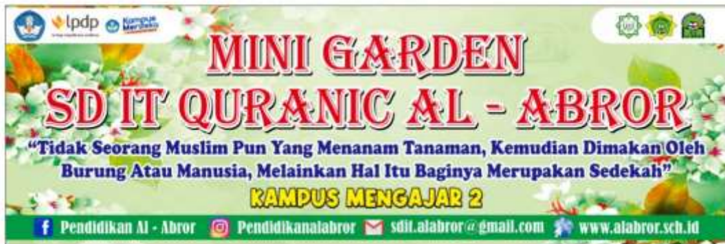
Gambar 21. Membuat banner untuk Mini Garden