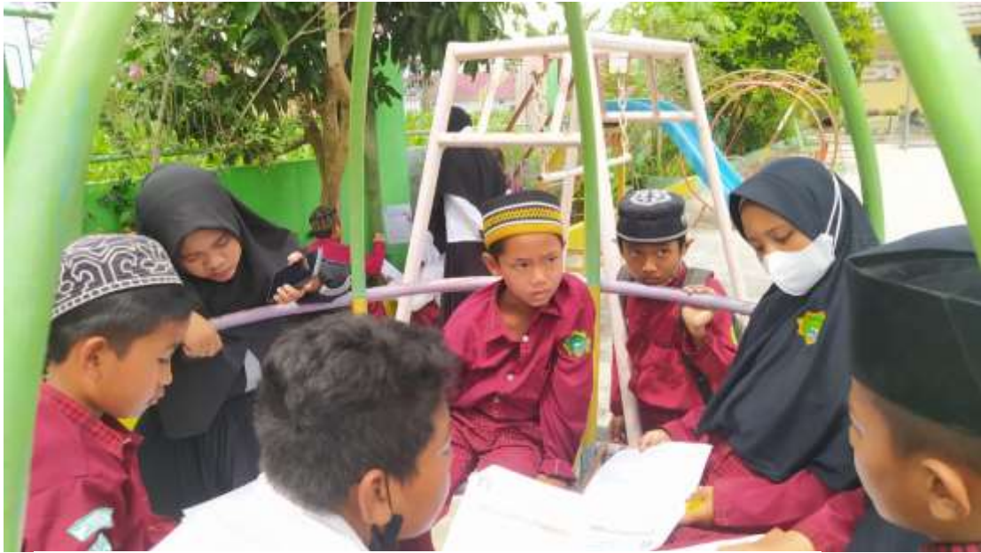
Gambar 33. Mendampingi siswa/l praktek tentang “Ekosistem”