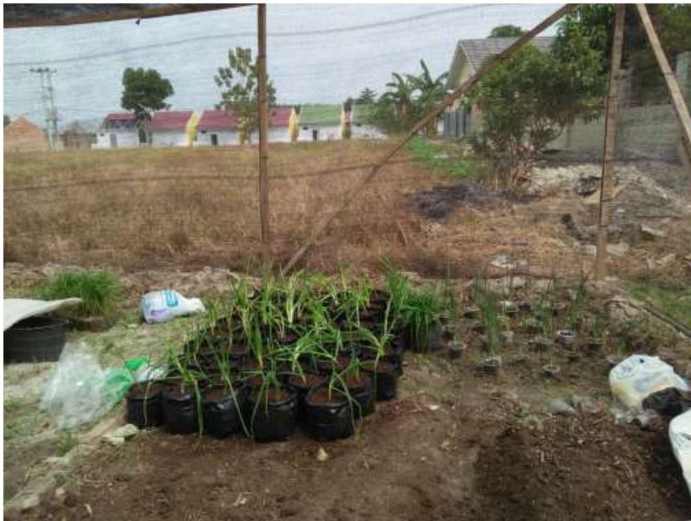
Gambar 24. Menanam tanaman di Mini Garden