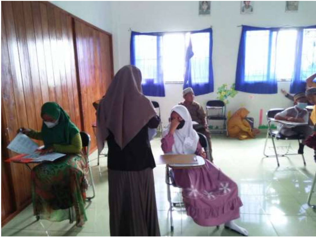
Gambar 19. Mengawas PTS