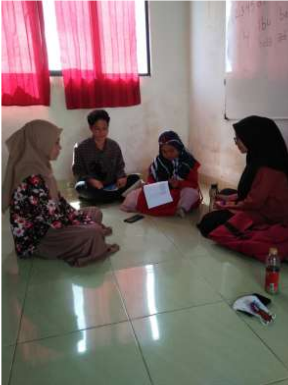
Gambar 4. Mendampingi peserta didik untuk mengikuti lomba menyanyikan Mars Pramuka dan lagu daerah Lampung ditingkat kecamatan