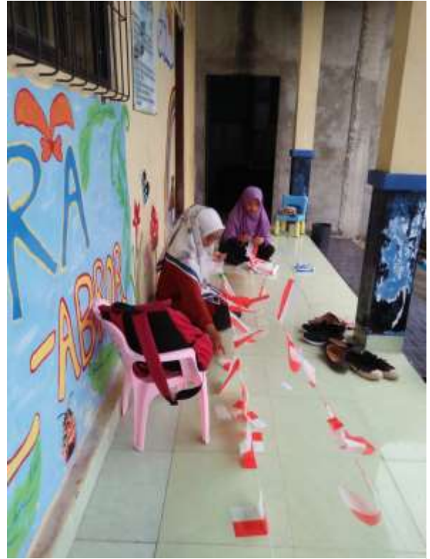
Gambar 5. Mendekorasi menyambut 17 Agustus