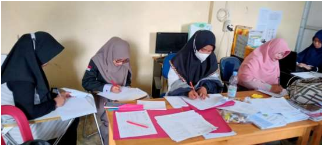
Gambar 20. Mengoreksi hasil PTS peserta didik