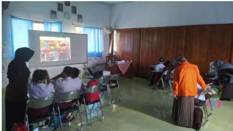
Gambar 2. Penerapan aplikasi Quizizz

Penggunaan teknologi menjadi suatu tuntutan dalam melangsungkan pekerjaan di masa pandemi covid-19. Tidak dapat dipungkiri bahwasannya teknologi menjadi salah satu solusi besar yang dapat memecahkan berbagai persoalan terkait kendala covid-19, khususnya pendidikan.