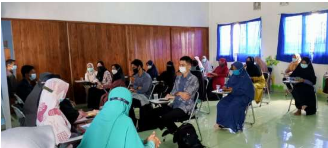
Gambar 3. Mengikuti kegiatan kumpu komite dan wali murid