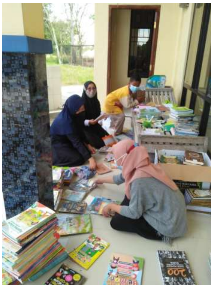
Gambar 22. Mendata dan merapikan perpustakaan