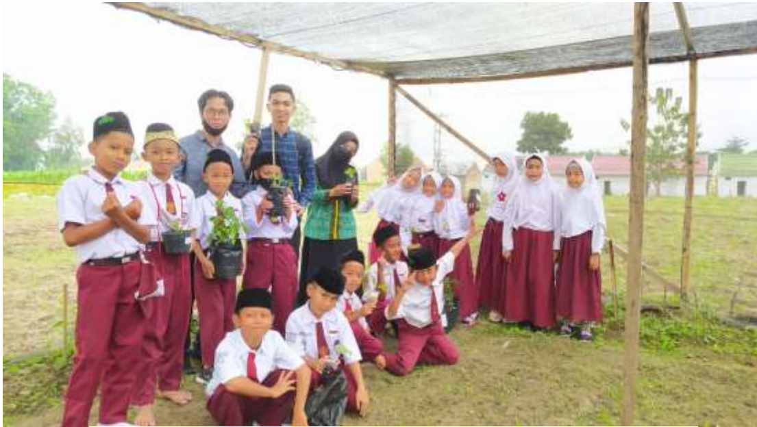
Gambar 3. Merawat mini garden