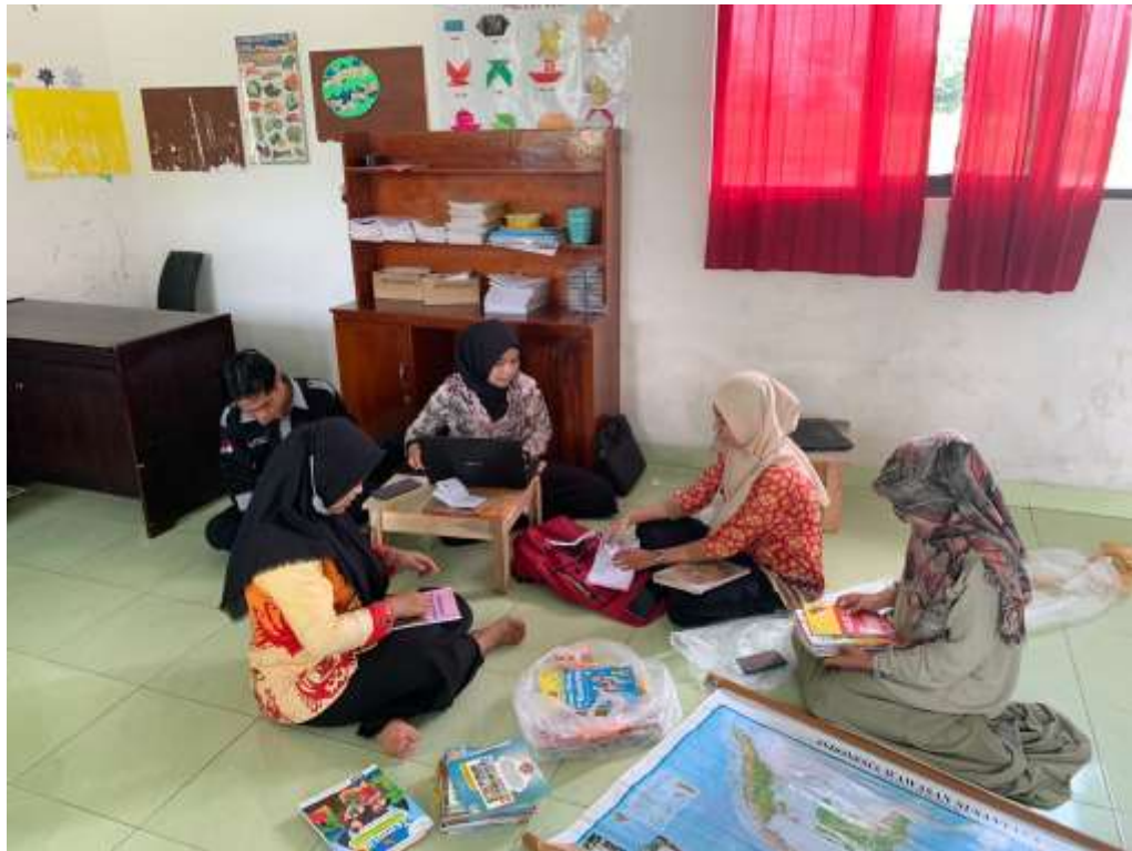
Gambar 35. Memberikan cap Kampus Mengajar pada buku donasi