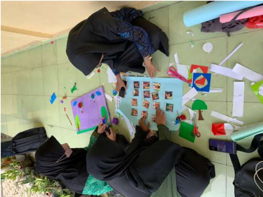
Gambar 34. Menghias Majalah Dinding