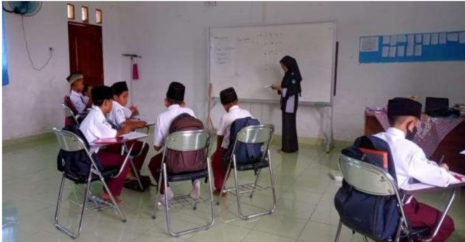
Gambar 1 Mengajar di kelas dengan tetap menjaga protokol Kesehatan

Kegiatan mengajar dilakukan di Sekolah dengan membagi dua sesi dalam pembelajaran. Kegiatan mengajar ditentukan berdasarkan jadwal yang telah ditentukan oleh sekolah dari kelas 1-5. Dalam pelaksanaannya, mahasiswa berkoordinasi dengan wali kelas setiap kelas menyesuaikan materi ajar yang sesuai dengan kurikulum. Mahasiswa melakukan evaluasi berdasarkan hasil belajar yang telah dilakukan. Cara yang mahasiswa gunakan dalam mengajar diharapkan dapat membantu guru dalam menyampaikan ilmu dan membantu siswa dalam memahami materi. Siswa yang diajarkan oleh mahasiswa memiliki semangat yang tinggi untuk melakukan pembelajaran.