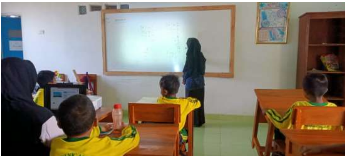
Gambar 30. Mengajar literasi dan numerasi kelas 1,2, dan 3