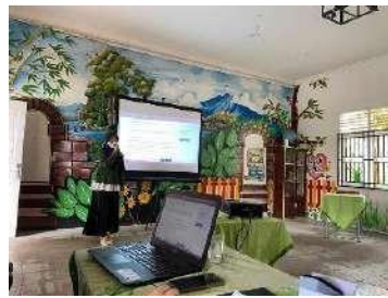
18. Minggu ke 17