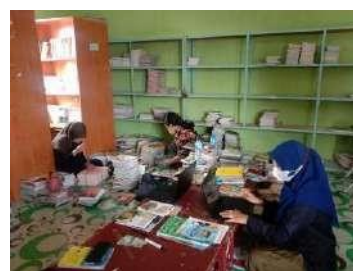
20. Minggu ke 19