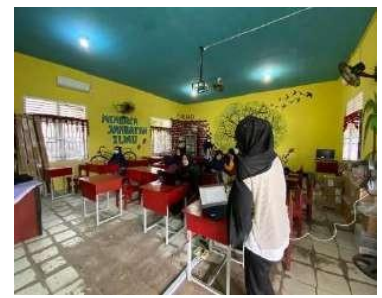
21. Minggu ke 20