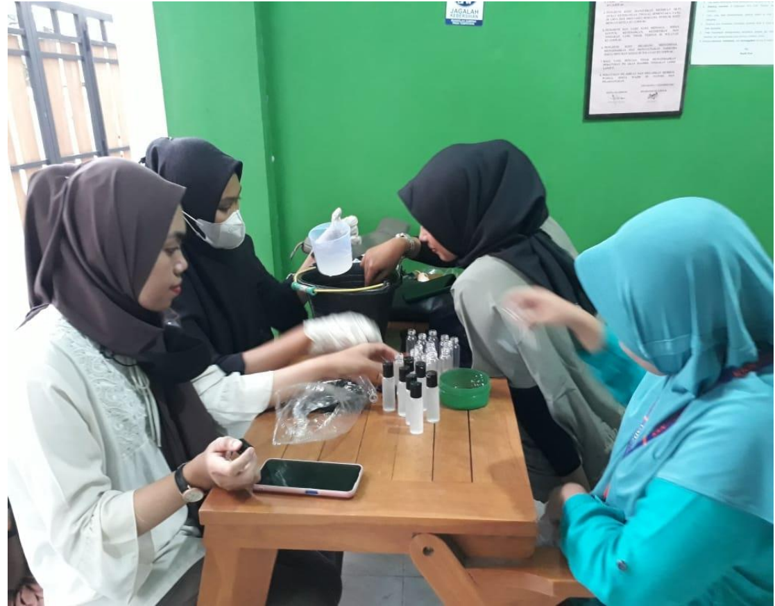
Gambar 2. Pembuatan Handsinitizer