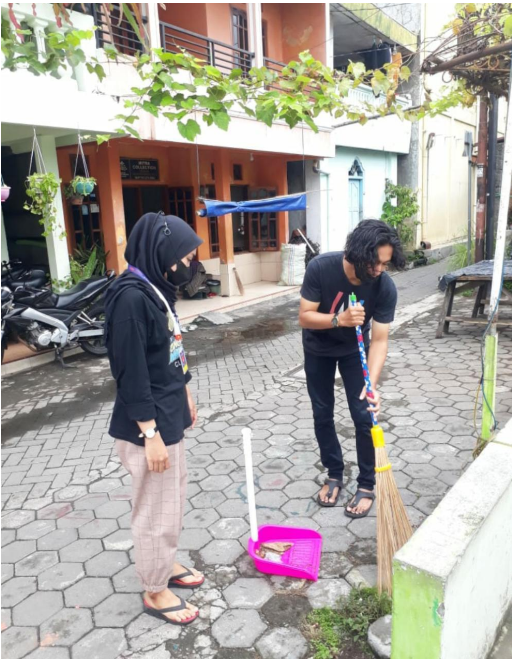
Gambar. 7 Kerja Bakti di Masjid Al- Huda Keparakan Kidul