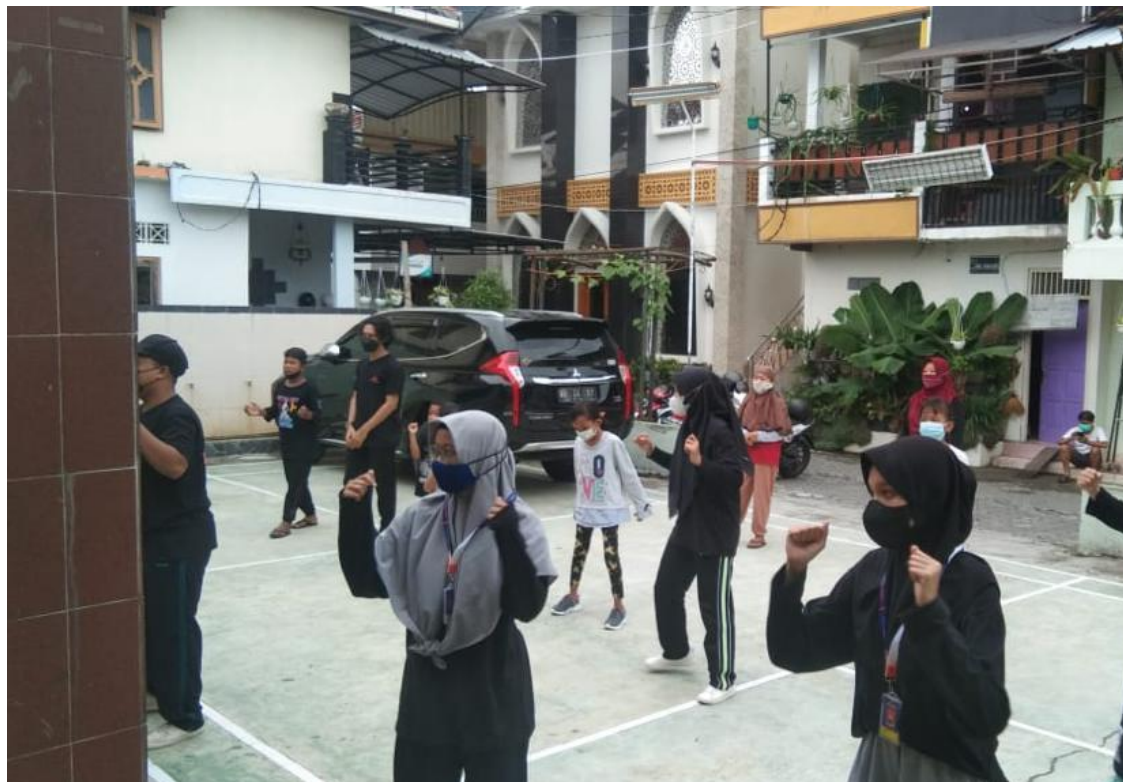
Gambar 4. Kegiatan Senam Bersama warga Keparakan Kidul