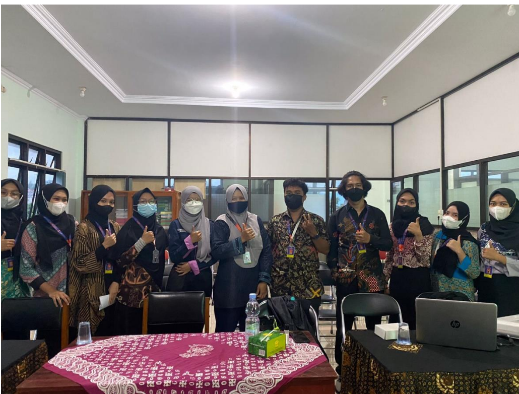
Gambar 3. Kegiatan Sosialisasi Vaksin dan PHBS