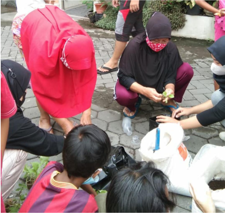
Gambar 1. Kegiatan Lorong Sayur