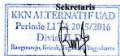
Repita Nawang Awisti NIM.12005209