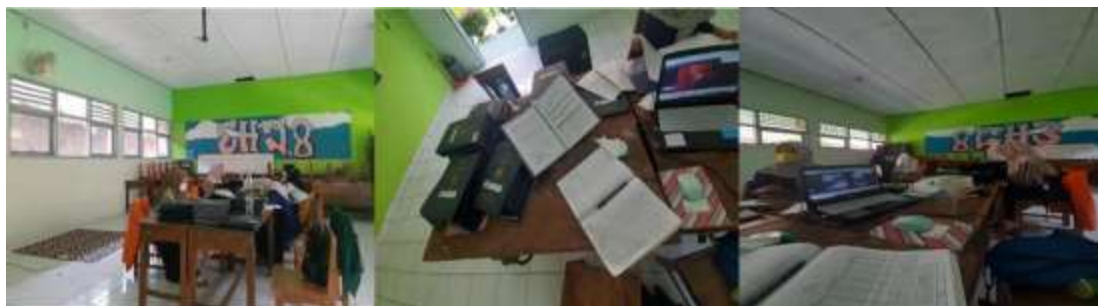
Kegiatan Jum'at, 13 Agustus 2021