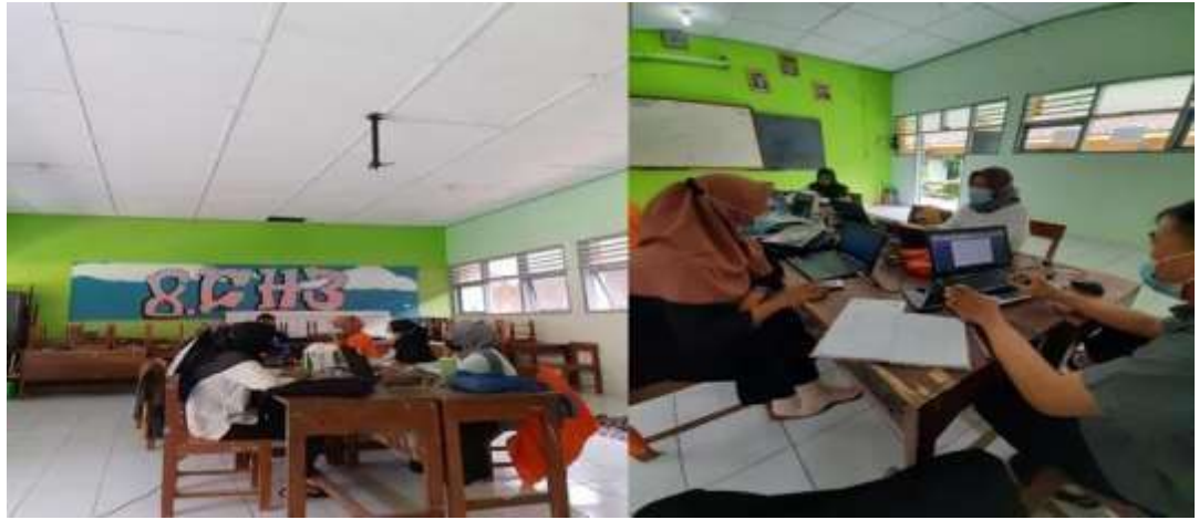
Kegiatan, Selasa 10 Agustus 2021

Kegiatan, Senin 9 Agustus 2021 : dalam kegiatan tersebut beberapa dari tim kami baru menyiapkan susunan acara dan menyiapkan teknis lomba untuk memperingatu hari Pramuka dan HUT RI Ke 76.