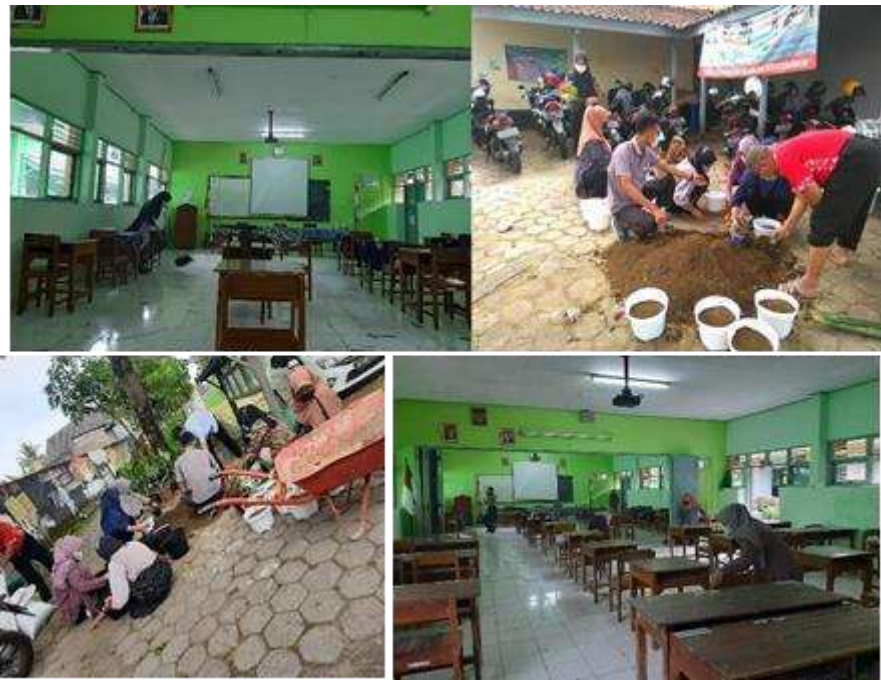
Kegiatan Sabtu, 14 Agustus 2021