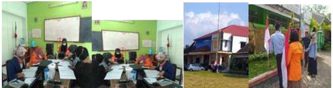
Kegiatan Kamis, 12 Agustus 2021