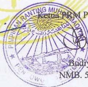
Budiyono NMB. 578.784