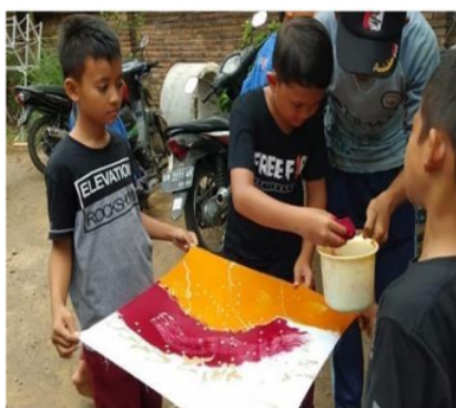
Gambar 5. Belajar batik di pengrajin batik

Kesepakatan sekolah dengan berbagai unit lingkungan sekolah direalisasikan dalam beberapa kegiatan. Kegiatan yang dilakukan antara lain pengolahan sampah sekolah dijadikan kompos dan eco enzim, tanaman empon-empon dijadikan jamu (ekstrakurikuler pembuatan jamu), kebun dan taman sekolah dijadikan sumber belajar IPA, sangkar burung dan kolam ikan sebagai sumber belajar IPA, belajar di luar kelas (pasar, bank, kantor kecamatan, puskesmas dll), belajar secara langsung ke pengusaha/pengrajin batik, dokter kecil, belajar menabung, pramuka, outbond, kunjungan ke kantor desa dan kantor kecamatan, bakti sosial, pembuatan pot dari barang bekas, studi di pabrik bakpia Tutut, penghijauan sekolah, dan sholat dhuha, ashar berjamaah di masjid. Secara umum, siswa senang dalam mengikuti kegiatan sekolah yang melibatkan unit di lingkungan sekolah ini. Hal ini dibuktikan dengan antusias siswa dalam mengikuti kegiatan (seperti terlihat pada gambar 5 dan gambar 6). Namun demikian, terdapat beberapa kendala yang dihadapi sekolah dalam menjalin kerja sama dengan mitra, yaitu pengkondisian ketertiban siswa saat melaksanakan kegiatan, transportasi dan keamanan siswa menuju lokasi mitra, dan keterbatasan sarana prasarana sekolah sebagai tindak lanjut belajar di unit usaha sekitar sekolah. Selama masa pandemi COVID-19 pemberdayaan lingkungan sekolah menjadi terbatas, bahkan beberapa kegiatan, seperti kunjungan ke tempat usaha, ke pasar, ke instansi pemerintah terdekat, tidak terlaksana.