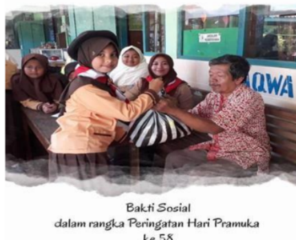
Bakti Sosial dalam rangka Peringatan Hari Pramuka ke 58