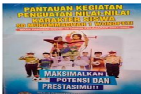
Gambar 2. Cover buku harian siswa