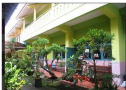
Gambar 1. Penataan taman sekolah