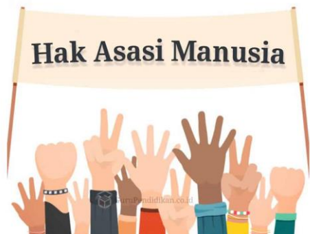
Gambar 4.1.