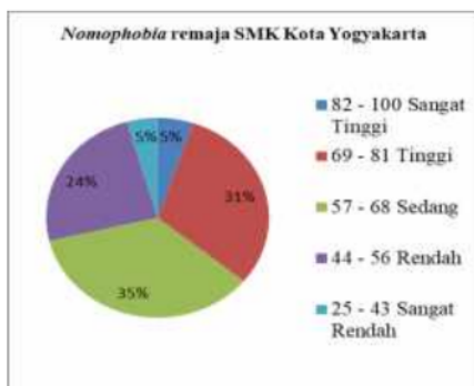
Gambar 1. Persentase Nomophobia Remaja SMK Kota Yogyakarta

Analisis selanjutnya berupa analisis persentase nomophobia remaja SMK di kota Yogyakarta. Secara lebih jelas dapat dilihat pada gambar 1 berikut ini.