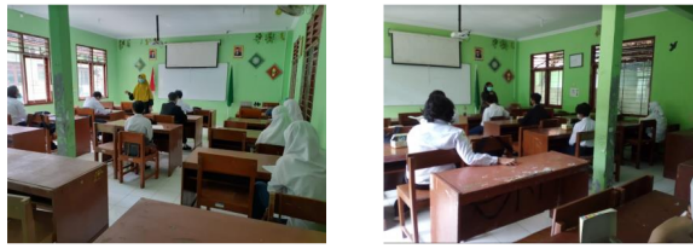
Gambar 1 Pelaksanaan pelatihan peer counsellor pada remaja anti nomophobia secara tatap muka ( offline )

4. Peran konselor/ guru bimbingan dan konseling di sekolah untuk mengatasi permasalahan tentang nomophobia dapat terbantu karena kehadiran peer counselor .