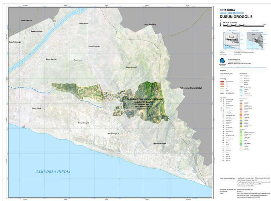
Gambar 1 Peta Dusun Grogol VIII, Parangtritis, Kretek, Bantul, DIY

Dusun Grogol VIII terbagi menjadi 4 RT dengan jumlah penduduk sebanyak 460 jiwa dengan komposisi penduduk laki-laki berkisar 220 jiwa dan penduduk perempuan berkisar 240 jiwa. Warga pendatang maupun luar daerah yang tinggal atau mengkontrak semuanya sudah memiliki KTP. Kelompok usia kerja atau warga yang produktif bekerja merupakan warga yang sudah menikah (berkisar usia 25 – 55), sedangkan warga usia remaja kebanyakan merupakan pelajar atau mahasiswa. Jumlah lansia yang produktif bekerja masih cukup banyak. Jumlah penduduk usia lansia di Dusun Grogol VIII berkisar 130 jiwa. Berdasarkan dari segi pendidikan rata-rata tingkat pendidikan penduduk Dusun Grogol VIII adalah SMP dan SMA. Penduduk usia lansia sebagian besar memiliki tingkat pendidikan tertinggi SD dan SMP, sedangkan penduduk usia produktif memiliki tingkat pendidikan akhir SMP dan SMA. Sarana pendidikan di Dusun Grogol VIII meliputi PAUD Bougenville, TK Kunci Melati, dan SD 1 Parangtritis.