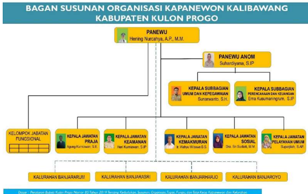
Gambar 1. Bagan Struktur Organisasi Kapanewon Kalibawang