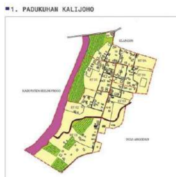
Gambar 1. Peta Padukuhan Kalijoho