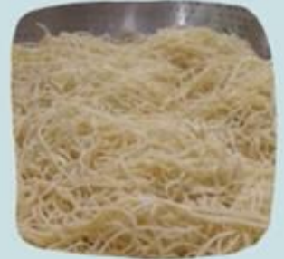
Mi Basah Sesuai Standar Perusahaan