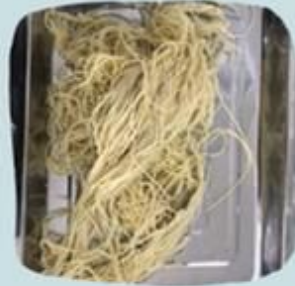
Mi Lengket dan Menyatu

Mi basah di CV. Sundoro Indonesia yang dikategorikan sebagai produk defect yaitu mi basah yang lengket dan untaian mi yang menyatu. Sedangkan mi basah yang sesuai dengan standar perusahaan adalah mi basah yang tidak lengket sehingga untaian mi terpisah.