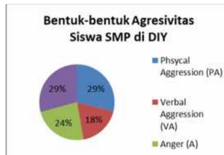
Gambar 2. Bentuk-bentuk Agresivitas Siswa di DIY

Deskripsi selanjutnya mengenai persentase agresivitas pada masing-masing bentuk secara lebih detail disajikan dalam gambar 2 berikut ini.