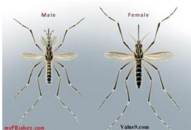
Gambar 3. Perbedaan nyamuk Aedes jantan dan betina.