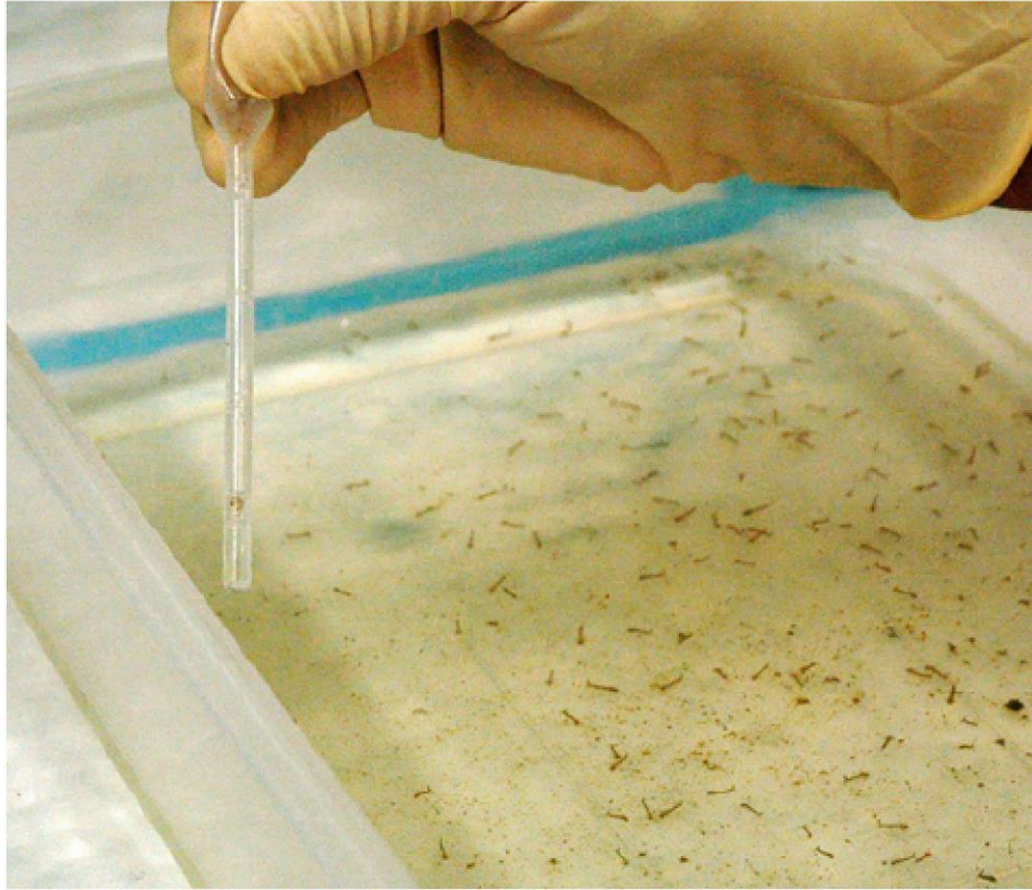
Gambar 2. Pengambilan Larva Aedes spp