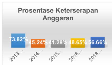
Gambar II. Keterserapan anggaran

Gambar di atas menunjukkan ketersediaan anggaran yang jumlahnya tidak mencapai 100% dan rata-rata ketersediaan anggaran berada dibawah 50% dari rencana anggaran. Hal ini menunjukkan bahwa secara garis besar program yang dicanangkan belum berjalan secara keseluruhan. Hal tersebut terkait dengan kendala sebelumnya, yakni perencanaan yang belum optimal, belum sistemik, sehingga kegiatan-kegiatan yang seharusnya berjalan penuh selama satu tahun anggaran ada yang terlepas, atau tertunda sampai mendekati tahun anggaran baru. Dengan demikian pengendalian berkala yang seharusnya dilakukan menjadi kurang berjalan lancar.