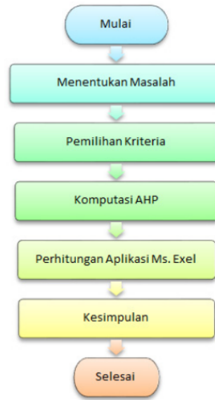
Gambar 2. Tahap-tahap penelitian

Kriteria-kriteria pada Tabel 2 dimasukkan ke dalam tabel perbandingan dua kriteria berpasangan seperti terlihat pada tabel 3.