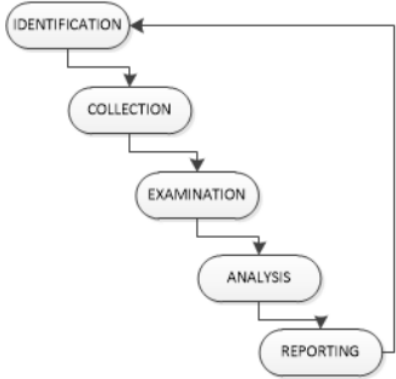
Gambar 5. Metode Tahapan Digital Forensics

Berdasarkan penelitian yang dilakukan oleh Ellick M. Chan maka peneliti akan menggunakan metodologi penelitian The U.S. National Institute of Justice (NIJ) yang digambarkan dengan alur sebagai berikut :