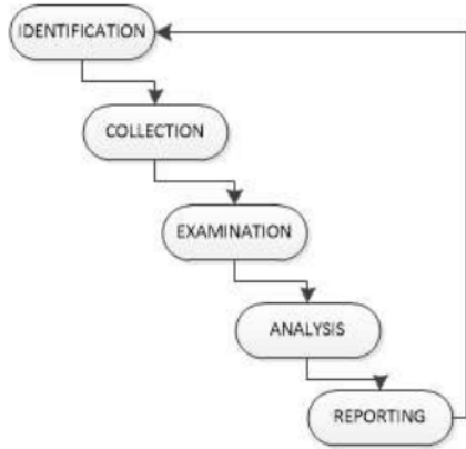
Gambar 5. Metode Tahapan Digital Forensics

Berdasarkan penelitian yang dilakukan oleh Ellick M. Chan maka peneliti akan menggunakan metodologi penelitian The U.S. National Institute of Justice (NIJ) yang digambarkan dengan alur sebagai berikut :