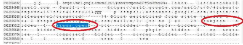
Gambar 8. Google Chrome type public terlihat subject email

Dari Gambar 7 menunjukkan bahwa Google Chrome dengan type public terlihat dengan jelas isi pesan yang dikirimkan yaitu baca pesan gmail dari chrome ke firefox open.