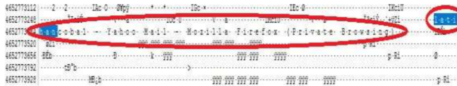
Gambar 10. Mozilla Firefox type private terlihat username

Dari Gambar 9 menunjukkan bahwa Microsoft Edge dengan type private masih dapat dilihat kontak email yaitu latihancoba1@yahoo.com .