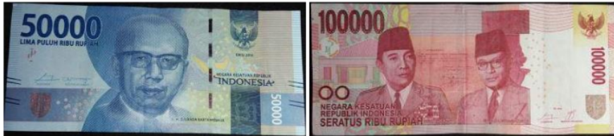
Gambar 2. Data awal masukan

Data awal masukan dapat dilihat pada gambar 2.