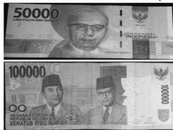
Gambar 3. Citra Greyscale