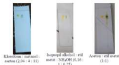
Gambar 1. Hasil optimasi fase gerak

Fase gerak yang digunakan berdasarkan penelitian Starek, dkk. (2015) yaitu kloroform : metanol : aseton (2,04 : 4 : 11), sedangkan perbandingan fase gerak isopropil alkohol : etil asetat : NH 4 OH (0,16 : 1 : 0,25) dan aseton : etil asetat (1:1) diperoleh dari penelitian Hernandez, dkk. (2018). Hasil elusi dapat dilihat pada Gambar 1.