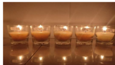
Gambar 7. Lilin dengan 100 gram stearin setelah dibakar

Data hasil uji organoleptik terhadap lilin dengan perbandingan minyak jelantah dan stearin yang digunakan adalah 1:1 yaitu 100 ml minyak jelantah : 100 gram stearin menggunakan 4 variasi perlakuan penyerapan minyak dengan karbon aktif (40 gram, 80 gram, 120 gram, dan tanpa penyerapan) tertera pada Tabel 4.