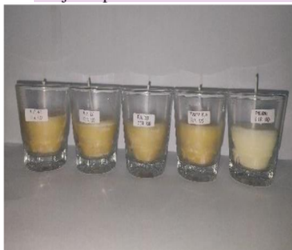
Gambar 6. Variasi karbon aktif

Hasil lilin menggunakan 100 gram stearin dengan berbagai variasi massa karbon aktif disajikan pada Gambar 6 dan Gambar 7.