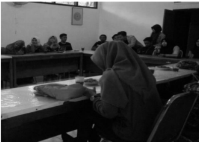
Gambar 2. Peserta sedang membaca dan berdiskusi terkait studi kasus yang diberikan fasilitator

Tahap selanjutnya setelah diberikan pengetahuan terkait peran remaja, teknik presentasi, dan teknik konseling sebaya serta pengetahuan tentang produk wedang uwuh dari segi kesehatan, peserta dibagi menjadi 2 (dua) kelompok dan masing-masing kelompok diberikan kasus yang berbeda-beda. Masing-masing kelompok diberikan tugas untuk menganalisis, mendiskusikan, dan memberikan alternative solusi dari masalah yang ada di dalam kasus, dipandang dari sisi remaja (Gambar 2).