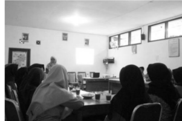
Gambar 3. Salah satu perwakilan kelompok sedang melakukan simulasi teknik presentasi

Bahan simulasi berasal dari hasil studi kasus masing-masing kelompok. Masing-masing kelompok menunjuk satu perwakilan dari kelompoknya untuk mensimulasikan keterampilan hidup yang dipilih sebagai alternative solusi penyelesaian masalah atas studi kasus yang diberikan fasilitator. Kelompok lain menilai simulasi yang dilakukan oleh kelompok lainnya (Gambar 3).